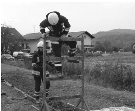
Premagovanje prve ovire