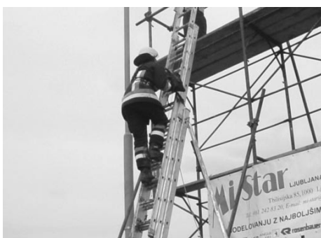
Vzpon po lestvi na stolp