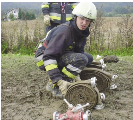
Priprava orodja na startu

Poročilo o dejavnosti GZ in PGD v mesecu požarne varnosti bomo objavili v naslednji številki Mengšana, saj se bodo nekatere dejavnosti odvijale vse do konca meseca novembra.