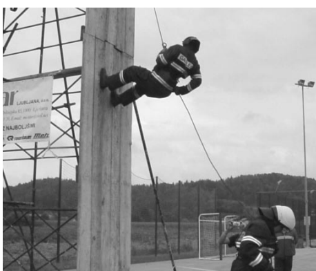
Spust po vrvi s stolpa