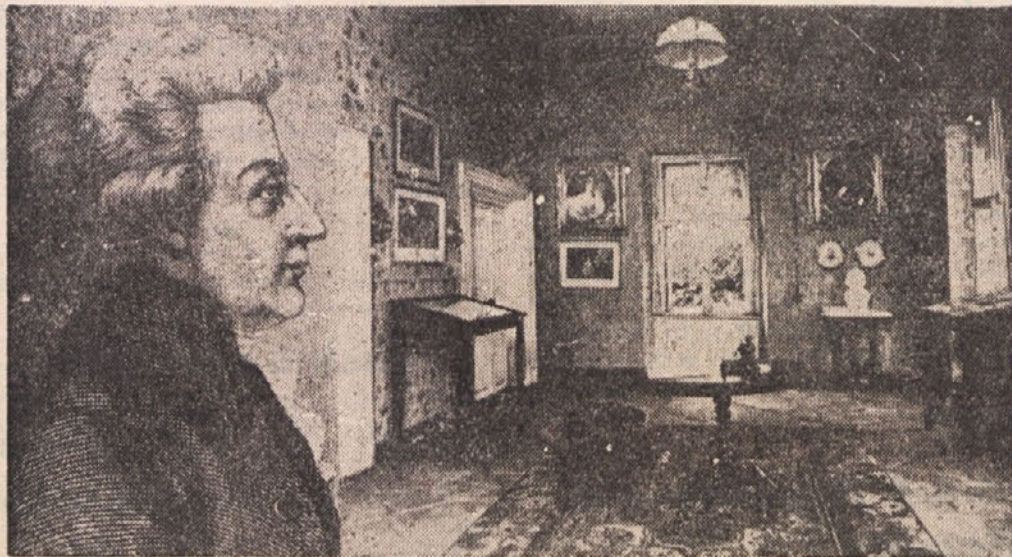
Na sliki (desno) vidimo sobo, v kateri je Mozart delal, ko je živel v Pragi; tukaj je nastala tudi njegova opera »Don Juan«.

smrtno tako v Avstriji kot ožji domovini umetnika kakor tudi v širnem svetu.