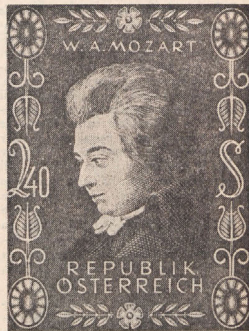
Najnovejša avstrijska znamka, ki jo je poštna uprava izdala za 200-letnico Mozartovega rojstva.

Svet, v katerem je Mozart živel in ustvarjal, umetnika in njegovega hotenja ni razumel odnoso ni hotel razumeti. Umrl je v siromaštvu, star komaj 35 let, in svoj zadnji počitek je našel v grobu za mestne reveže, o katerem še danes samo domnevajo, da je pač grob največjega avstrijskega mojstra glasbene umetnosti, o katerem je zapisal Franz Schubert: »Svetel in lep bo ostal ta dan skozi vse moje življenje. Kot od daleč mi še tiho zvenijo čarobni zvoki Mozartove glasbe. O Mozart, nesmrtni Mozart, koliko, kako neskončno mnogo takih blagodejnih odtokov svelejšega, lepšega življenja si vtisnil v našo dušo«.