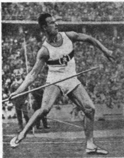
Nemški prvak Stöck meče kopje.

ter se v daljavi 71 m zapičilo v mehka, zelena tla. Seveda je treba pri metanju previdnosti, da kopje koga ne zadene. Spominjam se, ko sem bil še