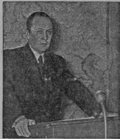
Walter Darre, nemški minister za prehrano in kmetijstvo