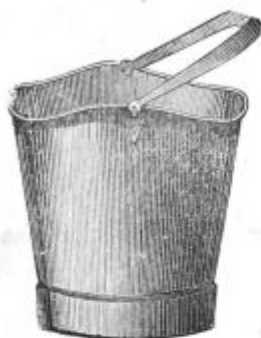
Pod. 47. Encenberška golida (od 8 l stane 4,60 K.).