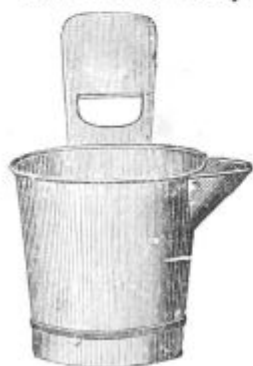
Pod. 45. Golida z nosom, (od 8 litrov stane 4 K.)

vnovič v golido, pridejo v mleko. To mleko se zato bolj hitro pokvari. V kositerni golidi pa ni razpok, niti se ne napije ploščevina z mlekom. Zato tako golido mnogo lažje dobro operemo. Ker ne ostaja toraj mleko v golidi, ne naselijo se vanjo niti glive in zato ostane mleko v tako golido namolženo več časa sveže. Kositernih golid je več vrst. Podobe 45. do 47. kažejo razne golide.