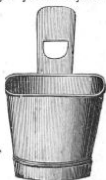
Pod. 46. Ovalna golida (oe 8 litrov stane 4 K.).