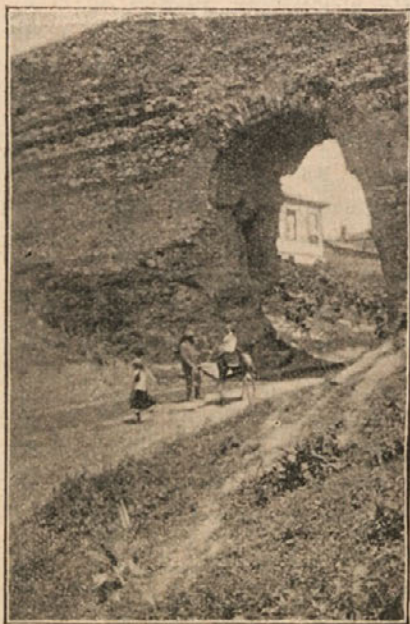
Хиссаръ (западната порта).