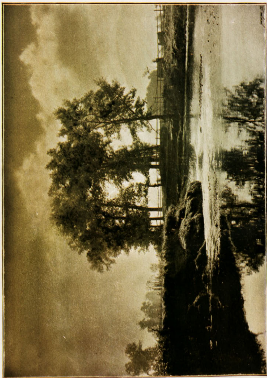
Прѣди бурата. — Пред невінто.