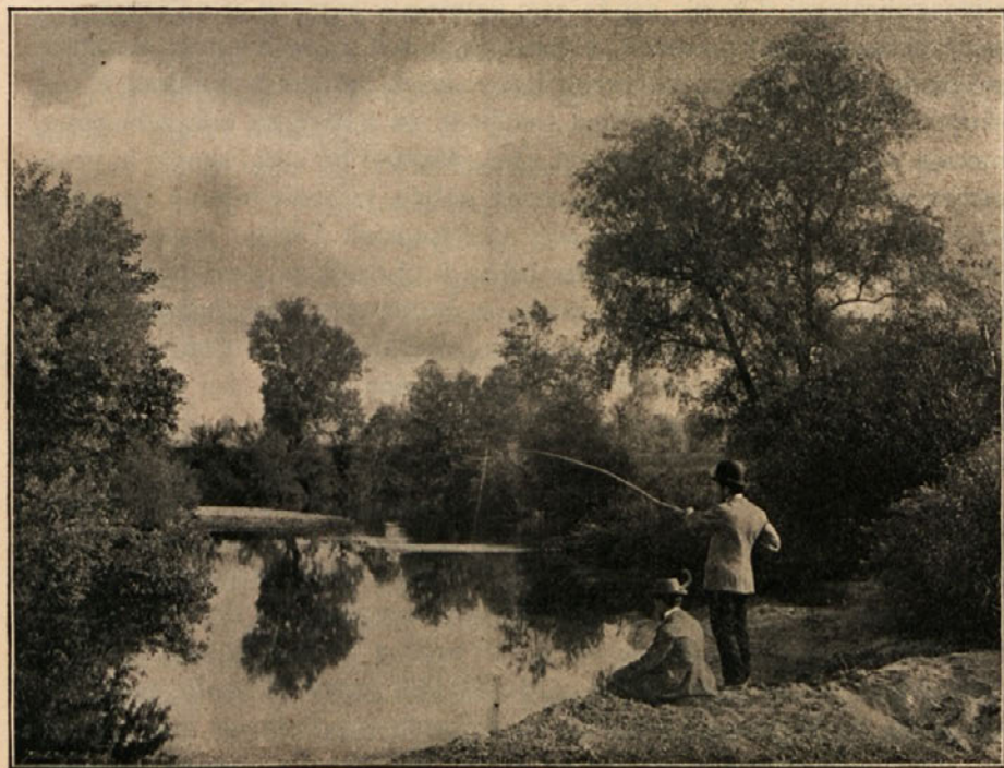
Nedeljski ribiĉ. — Недѣлни риболовецъ.