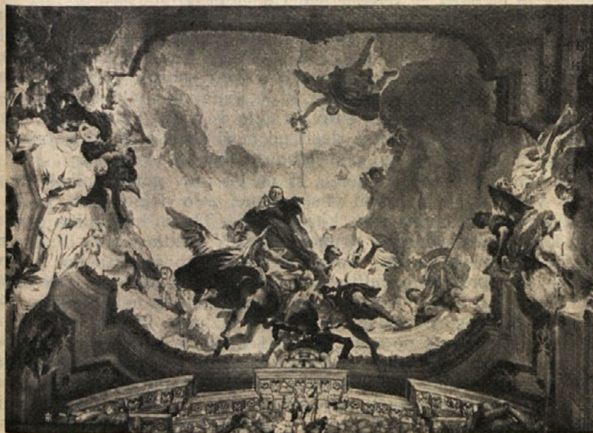
Benetke, cerkev oo. karmeličanov. Sv. Terezija v poveličanju

Po takih krizah je bila Terezija še bolj ponižna in še bolj je vzljubila Boga: »Nehote razumemo, da imamo Gospoda nad seboj in da te milosti On sam naklanja in da sami od sebe prav nič ne premoremo. On, ki zamore vse to povzročiti, se prikaže našemu srcu v tolikem veličanstvu, da nas prevzame bojazen in trepet tako velikega Boga kakorkoli razžaliti. Toda to je zvezano z neskončno ljubeznijo, ko se Bog tako zelo poniža do človeka, da ne dvigne samo duše k sebi, temveč tudi ubogo telo, to telo smrti, ki se je s tolikimi grehi omadeževalo.« Nadaljnji učinek teh zamaknjenj je neka čisto posebna sproščenost, ki je ne morem niti orisati. Vse, kar bi mogla o tem reči ali povedati, je samo to, da Bog hoče, naj