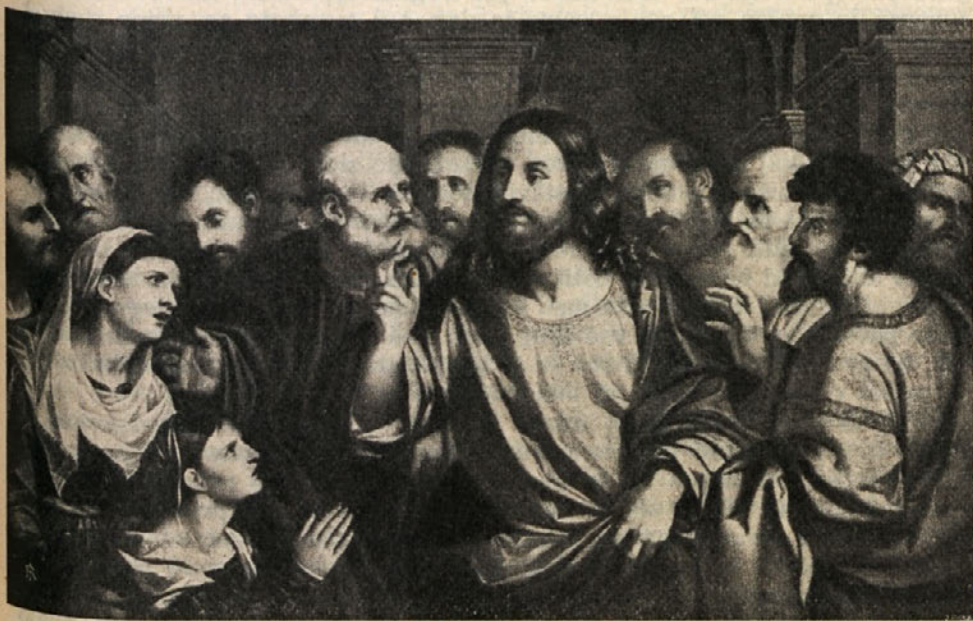
Palma Vecchio: Kristus gre iz shodnice

Prve čase ga često dobimo v Kafarnaumu. Tod je izhodišče in konec njegovih potovanj. Matej omenja ta kraj kot »njegovno mesto«. Kafarnaum je v naših jezikih zadobil pomen zmede in vrveža. Res se je prvotna kmetiška in ribiška vas zadnje čase povečala in razširila. Ležeča ob karavanski cesti od Damaska preko Itureje do morja je sčasoma postala važno trgovsko središče. Naselili so se tjakaj rokodelci, kupčevalci, trgovci, mešetarji in kramarji. Videti je bilo finančne uslužbence — ki muham podobno hite na zrele hruške — bili so: mitninarji, carinski uradniki in drugi čuvarji državnega zaklada. Mali trg, na pol kmetski na pol ribiški, je postal mešano in pisano mesto, kjer je bila zastopana vsa takratna družba — tudi vojaki in vlačuge. Toda Kafarnaum, ki je ležal ob jezer-