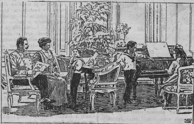
Der österreichische Thronfolger mit Familie.

Zastopal je cesarja tudi pri raznih drugih prilikah in je v njegovem imenu potoval na angleški dvor. Pri ti priliki se je prehladil, in ker