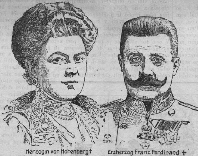
Herzogin von Hohenberg †

Dunaj. „Reichspost“ poroča o zadnjih trenutkih nadvojvode Franca Ferdinanda in njegove soproge neka vojaška oseba, ki je bila vedno v bližini nadvojvode, sledeče: „Vojvodinja Hohenburška je padla, zadeta od prve krogle v desno stran boka, na stran nadvojvodi v naročje. „Kaj ti je?“ je zaklical nadvojvoda in se nekoliko dvignil s sedeža, a v naslednjem hipu je razprostrl roke in se zgrudil nazaj v voz. Kroglja je zadela nadvojvodo pri grlu. Vratna žila je bila pretrgana, curek krvi je skočil iz male rane in v naslednjem trenutku je bil prsni del nadvojvodove suknje ves oblit s krvjo. Avtomobil je peljal še kakih deset korakov dalje in nato