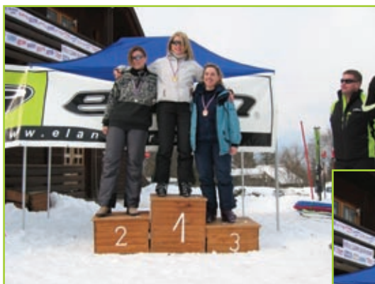
Veleslalom ski, ženske do 35 let