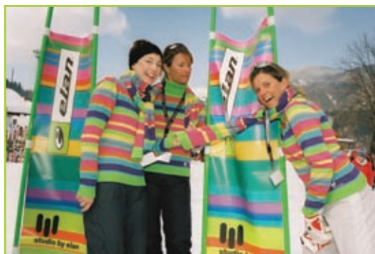
Dobra volja je najbolja

Kaj je to pogum? Če prideš po prekrokani noči pijan domov in te žena pričaka z metlo v rokah, ti pa si jo upaš vprašati: "Ali pospravljaš, ali se že kam odpravljaš?"