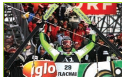
Dragšičevo navdušenje ob rezultatu