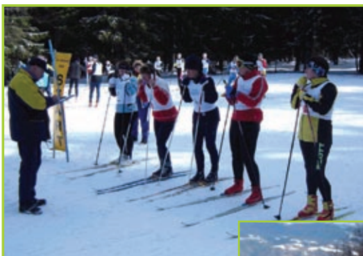
Pred štartom teka na smučeh za ženske

Elan je športno podjetje in bila bi velika škoda, če na tem tekmovanju ne bi sodeloval. Ponovna skupinska zmaga, ki smo jo dosegli na (ne)srečni dan, 13. februarja, je še toliko bolj vzpodbudila vse sodelujoče, da se bomo na to tekmovanje temeljito pripravili tudi naslednje leto. Pa ne samo po tekmovalni plati, kajti tukaj smo že dokazali, da znamo zmagovati, pač pa tudi po celostni podobi vseh sodelujočih, pri čemer pa bomo potrebovali pomoč in posluš naših nadrejenih.