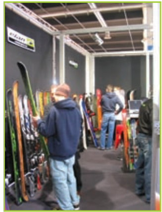
Elan v Švici