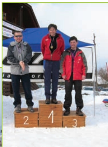
Tek na smučeh, moški do 40 let