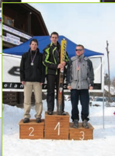
Veleslalom ski, moški do 30 let