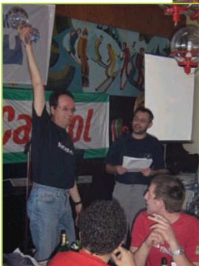
Elan je najboljši!