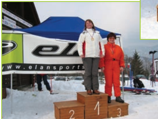
Veleslalom ski, ženske nad 35 let