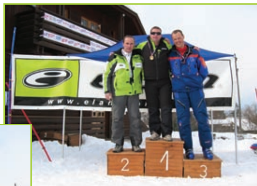
Veleslalom ski, moški od 31 do 45 let