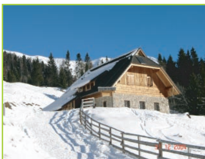
Slika 1: vikend ob poti

Pogled proti vrhu gore nam da dodatnih motivov, da jo osvojimo. Nekje od 20 do 30 minut bomo še potrebovali do cilja.