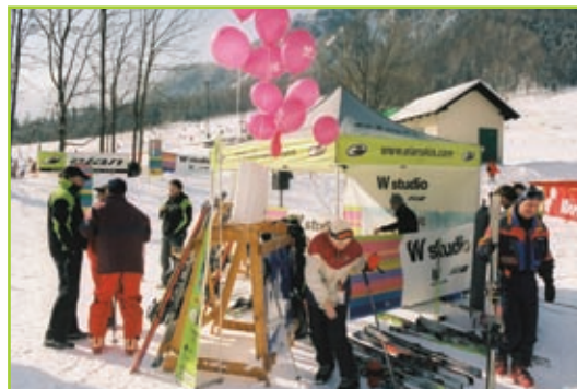
Lady test center

Bil je petek, dan pred dogodkom, ko je še veselo snežilo, mi pa smo se bali, da so vse skupaj odpadlo. V soboto zjutraj sem že ob sedmi uri zjutraj prejela sms sporočilo: V Kranjski je sonce. In dan je bil takoj prijetnejši.