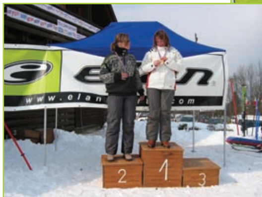
Tek na smučeh, ženske (bolje ženski)