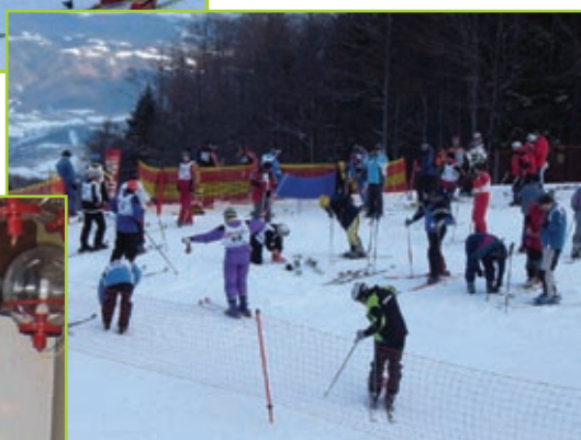
Pred štartom veleslaloma