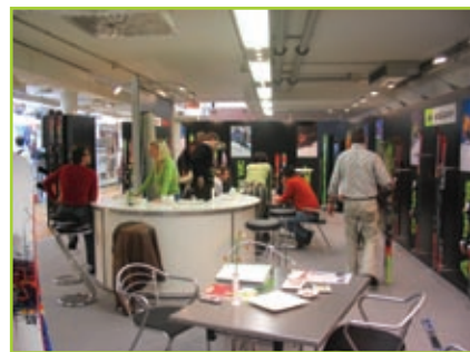
Elan v Avstriji