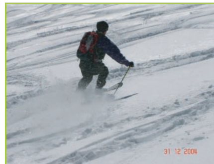
Ena od možnosti spusta proti dolini