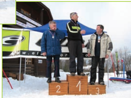
Veleslalom ski, moški nad 45 let