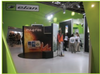
ISPO – Elanov razstavni prostor