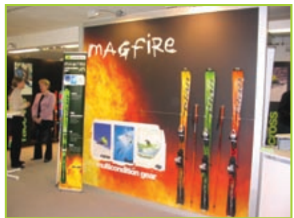
Elan v Avstriji