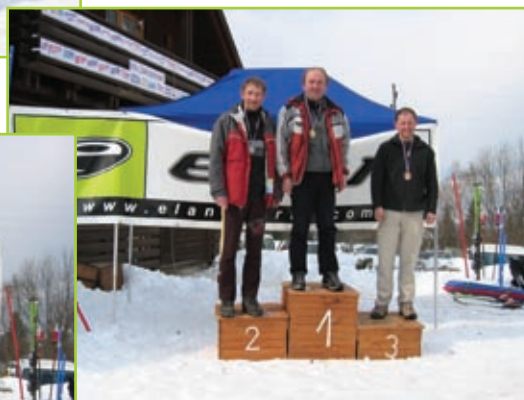
Tek na smučeh, moški nad 40 let