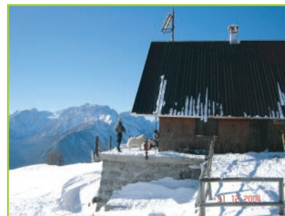
Slika 2: kočja za kratek postanek

Peter je iz davčne uprave prejel vrnjeno davčno napoved s pripisom: "Pogrešamo prihodke vaše žene!" Peter je odgovoril: "Jaz tudi!"