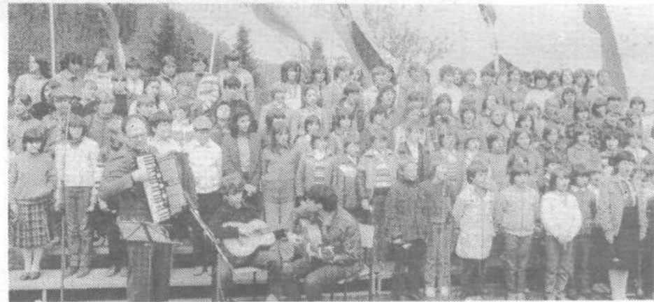
Pesem mladosti, svobode in vznesenosti prežeta z revolucionarnim izročilom je bila ob spremeljavi viške godbe na pihala in v izvedbi šolskih zborov iz OŠ Ljubo Šercer Ig in Oskar Kovačič izpeta udeležencem in prazniku v pozdrav.