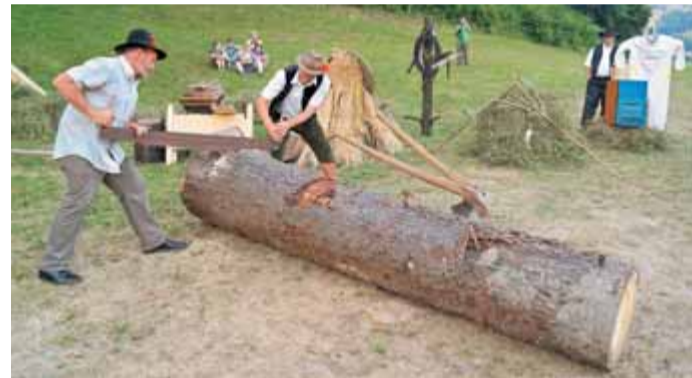
Rdeča nit vseh osmih prireditev je bila prikaz Tuhinjske doline nekdanj, tudi skozi običaje in domača opravila.