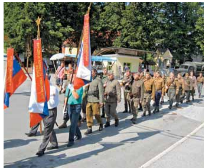
Slovesnost so naznanili prapori in prihod partizanske enote.