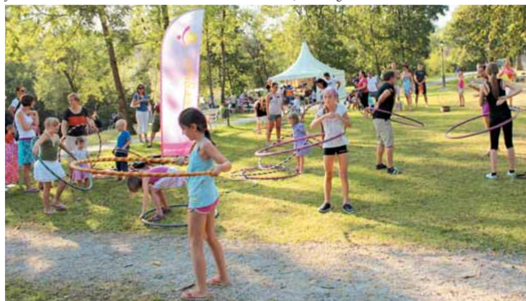
Zadnji dan festivala se je v parku vse vrtelo. Ponovno moderni obroči so zasvojili otroke, mamice in očke. Vsi skupaj so se pošteno nasmejali in zabavali.