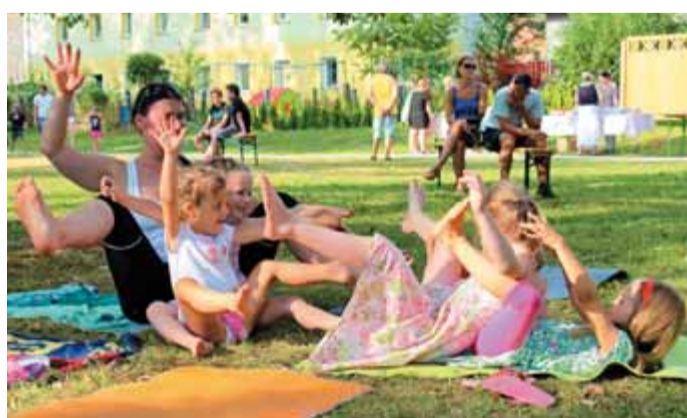
Vsak dan se je že pred otroško predstavo v Keršmančevem parku marsikaj dogajalo. Nekje se je bralo, drugje ustvarjalo, pa telovadilo. Park so zavzele tudi hobotnice, ki so prešerno nasmejene prilezle iz Kamniške Bistrice na Bofitovo mavrično gibalnico.