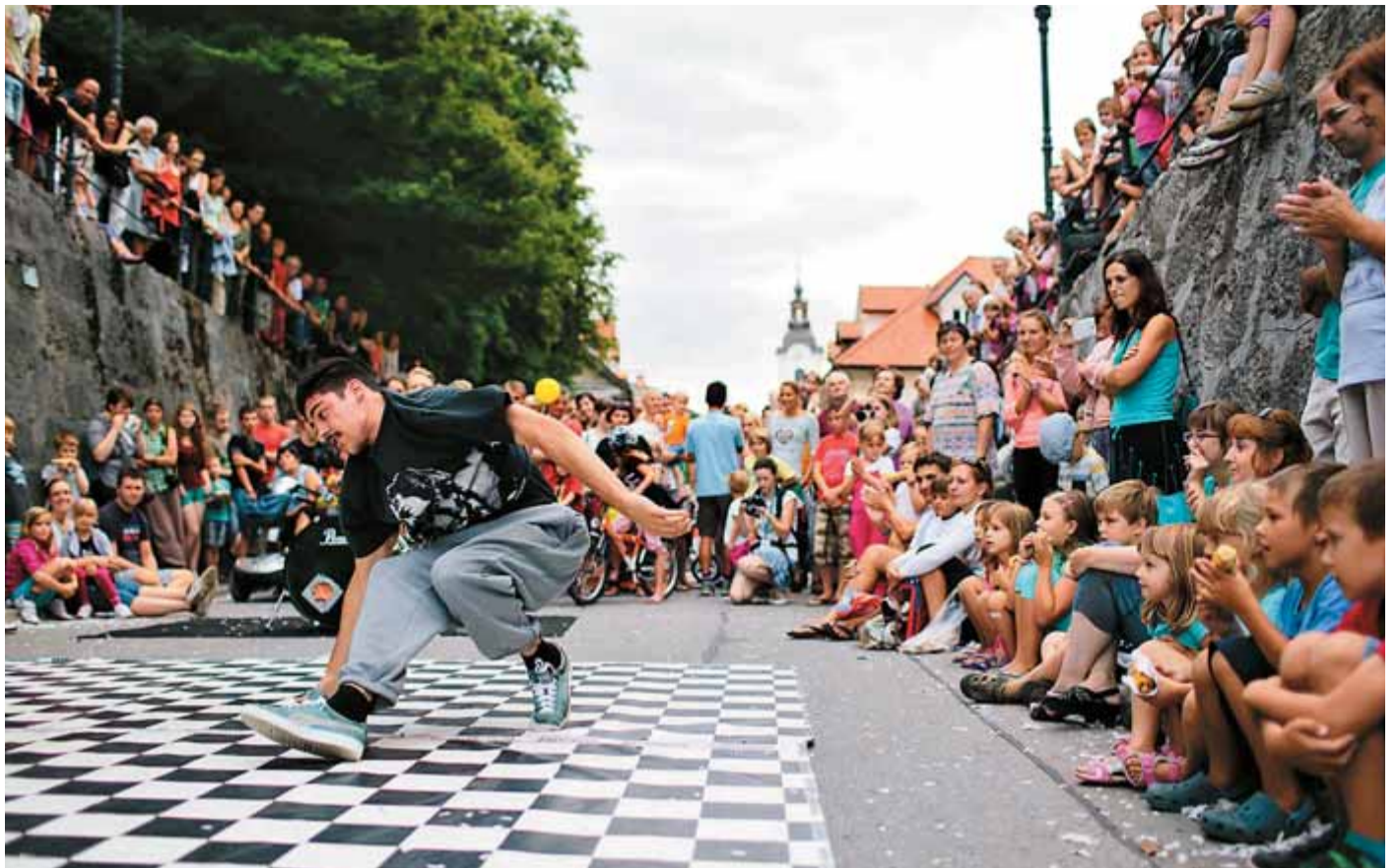
Drugi dan Kamfesta je obiskovalce navduševala break dance skupina. The Rock Street Show z živo spremljavo bobnov in basov je v Samčev predor pritegnila mnogo mladih obiskovalcev, ki so z odprtimi usti strmeli v »zvijanje« kamniških fantov.