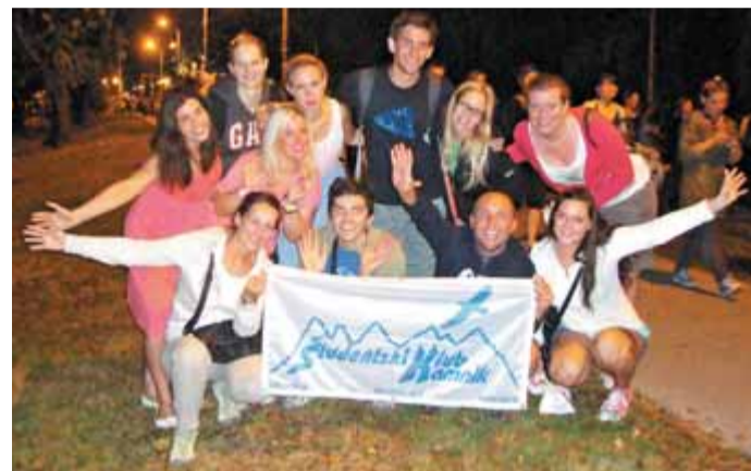
Obiskali smo koncert svetovno znane pop ikone Robbieja Williamsa v Zagrebu

Rdeča nit študentskega poletja v Kamniku so bile morske srede. Vsako poletno sredo smo se namreč odpravili na morje. V Študentskem klubu Kamnik se zavedamo, da je marsikdo za tovrstne užitke prikrajšan. Zato je bil naš namen odpeljati čim več študentov na morje. Za tiste, ki jim morje ni prav blizu, pa se je tudi v Kamniku našla osvežitev. Kamniški bazen je bil v poletnih vročih dneh poln in v njem so uživali tudi člani Študentskega kluba Kamnik, saj smo za njih pripravili še posebej ugodno ponudbo. Poleg morskih užtkov so na svoj račun prišli tudi kolesarski navdušenci. Tisti najbolj zagrizeni so se odpravili na tedenski kolesarski oddih po Sondrijskih Alpah, bazo pa so imeli postavljeno v idiličnem Livignu. Za ljubitelje adrenalina Krvavec ponuja pustolovski park, ki smo ga preizkusili tudi ŠKK-jevci in bili nad njim navdušeni. Če bo zanimanja dovolj, se tja odpravimo tudi septembra. Poleg športnih aktivnosti nismo pozabili niti na zabavo. Obiskali smo koncert svetovno znane pop ikone Robbieja Williamsa v Zagrebu. Zdelo se nam je, da tovrstne priložnosti enostavno ne smemo zamuditi. In nismo se zmotili. Koncert je bil veličasten in mogočen, Robbie je dokazal, da je zvezda v pravem pomenu besede.