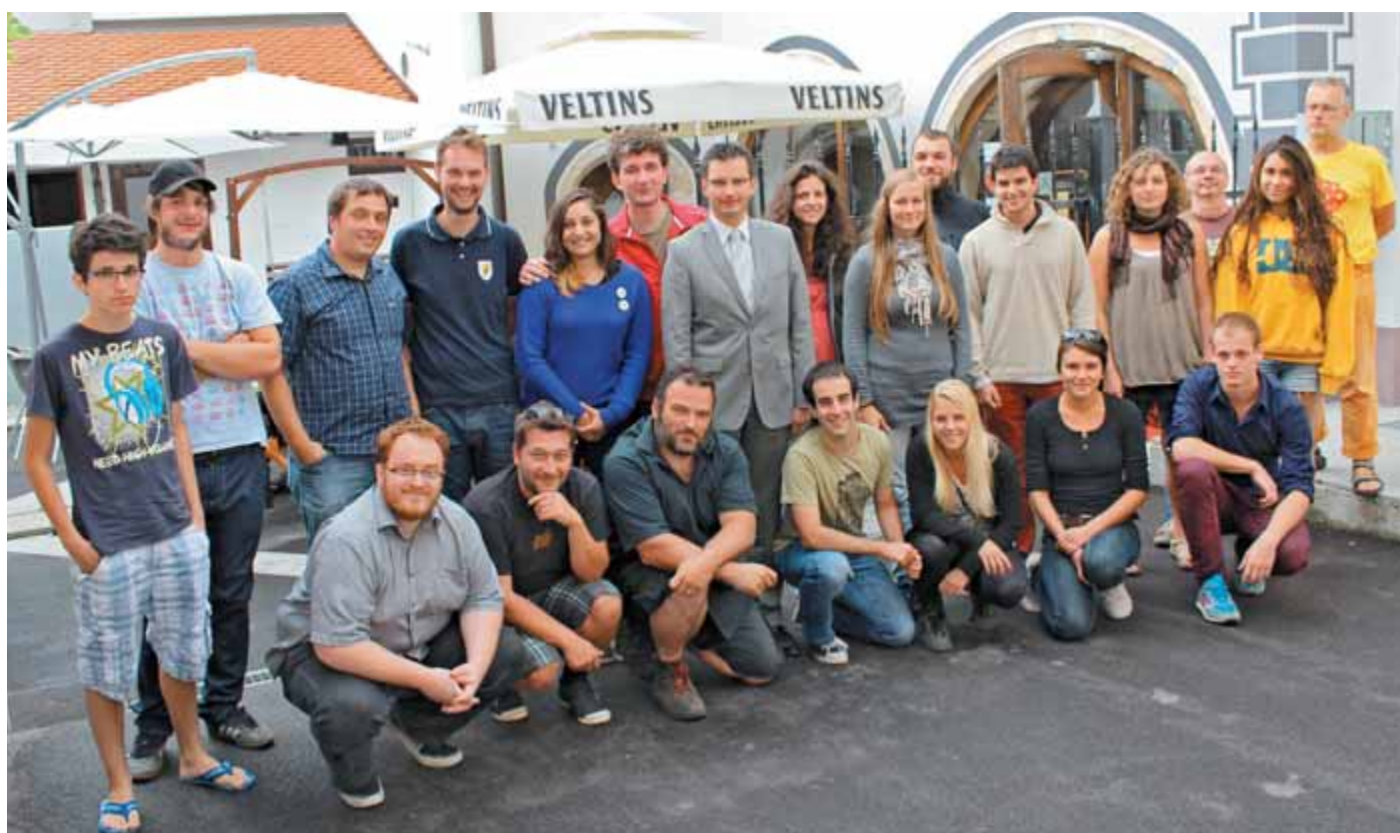
Dva dni po zaključku letošnjega jubilejnega festivala Kamfest je župan Marjan Šarec sprejel celotno ekipo Kamfesta. Organizator festivala KD Priden močič s soproducenti in prostovoljci iz tujine so tudi jubilejni festival z razgledom izpeljali več kot uspešno in pripeljali v mesto rekordno število obiskovalcev.

Davnega leta 2003 je ekipa entuziastov iz Kulturnega društva Priden močič in njihovih prijateljev na Mali grad v središču Kamnika znesla velik lesen oder, ki so si ga