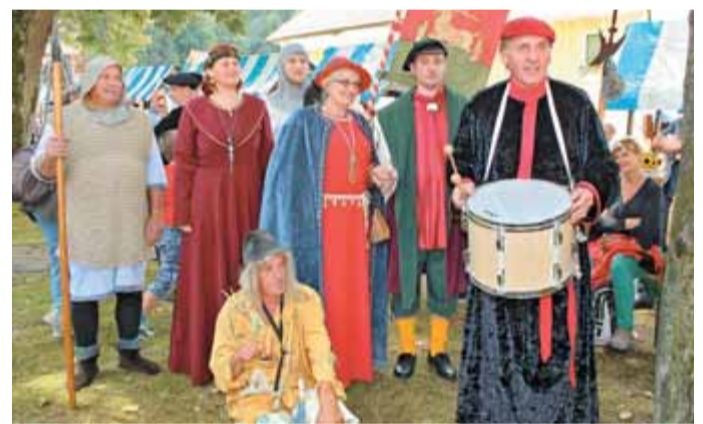
Gospoda iz Pilštanja je vabila na prangerjado v njihove kraje naslednje leto.