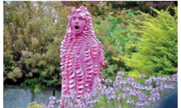
Najbolj roza vesoljska invazija v galaksiji je zavzela letošnji Kamfest! Člani kulturno-umetniškega društva Kud Ljud ali krajše ljudovci so tudi v Kamniku odgovarjali na zagotovo najpogostejše vprašanje, ki se porodi gledalcu njihove predstave Invazija: kako hudiča spravijo s sebe dol vso to roza barvo? Ljudovci v Invaziji raziskujejo mesto, iščejo kontakt s človeško vrsto in nas učijo svojih navad. So se Kamničani kaj naučili?