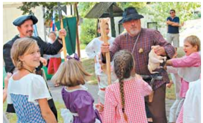
Tat Pepče izpod Menine planine je bil obtožen, da je v gostilni sunil kokoš, sam pa trdil, da mu je kar sama priletela v roko.