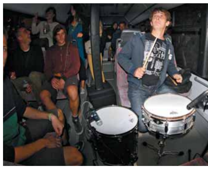
Kam bus je avtobus, ki je na letošnjem Kamfestu olajšal pot obiskovalcem festivala na relaciji Kamnik-Ljubljana. Ne samo, da sta Kam bus in Kamnik bus v času festivala vozila brezplačno, v in na Kam bus so na praznični četrtek postavili večerno koncertno dogajanje. Kamfest zares zmore vse!