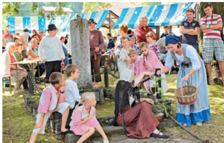
Javne sramote, ki so jo mimoidoči začinili z metanjem gnilih jajc, zelenjave in tudi manjšega kamenja, so bili deležni grešniki, ki niso sodili v ječo. Grešnike in grešnice so privezali ob pranger, ki je služil posmehu, po Sloveniji je ohranjenih še dvanajst takšnih sramotilnih kamnov.