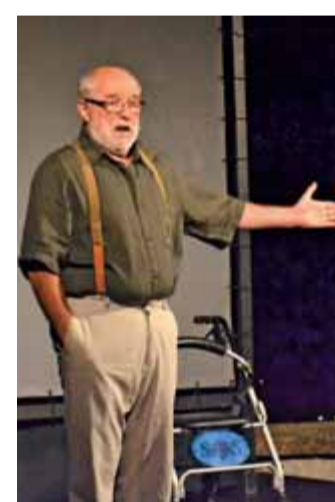
Letošnja glavna novost Kamfesta je bil čisto pravi letni kino in gledališče pod zvezdami. Na gradu Zaprice je bila legendarna monokomedija Uroša Fürsta Jamski človek razprodana, vzdušje pa enkratno z veliko komunikacije med igralcem in občinstvom. Podobno je bilo z Rifletovim Starim fotrom, le da je vse malce zeblo.