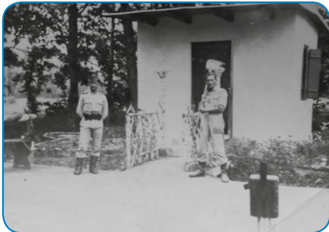
Kejpi je iz leta 1941, gda je oča sodak bijo

- Slejdnji kejpi, ka ga v rokej mam, je edna razglednica (képeslap), koma pa gda so