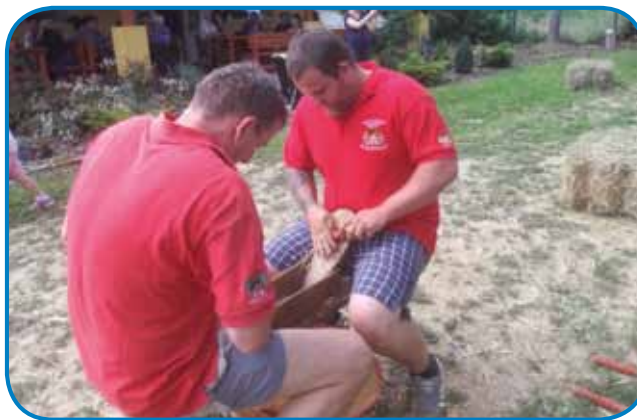
»Gasilca« luščita koruzo