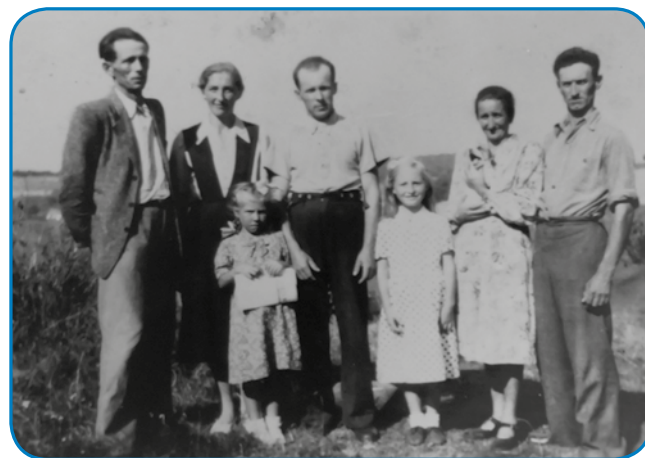
Družinski kejpi iz 50-t lejt

oča, potistim so se te tak oženili. Na tom družinskem kejpi se vi že tū vidite.