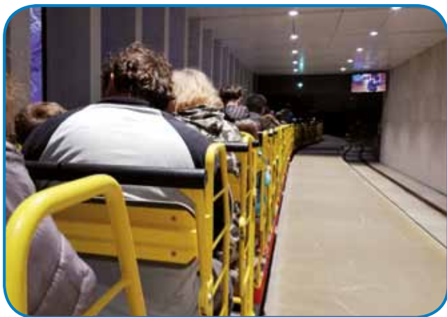
Inda so mali cug v Postojnskoj djami tiskali vodiči, zdaj ga vleče lokomotiva