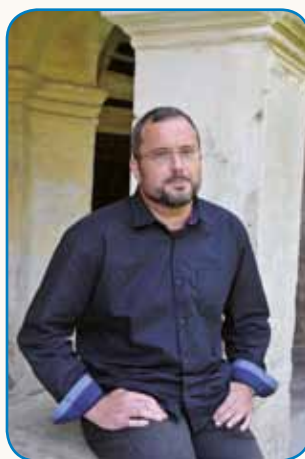
»VSI SAMO IŠČEJO SVOJE PRAVICE...« stran 4