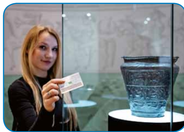
Razstava Vačke situle

Ob odprtju dneva muzejev na Metelkovi ploščadi v Ljubljani, pred Etnografskim muzejem, so istočasno odprli razstave tudi drugod, in sicer v Moderni galeriji, Muzeju krščanstva na Slovenskem, Muzeju novejšje zgodovine Slovenije, v MAO Slovenija, Narodni galeriji, Narodnem muzeju, Prirodoslovnem muzeju, v Slovenski kino-