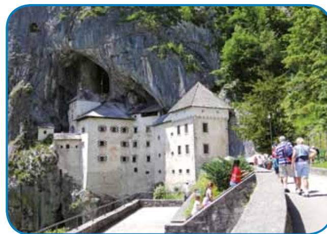
Predjamski grad je pred djamov na srejdji 123 mejterov visike kamene stene

V Postojnskoj djami je konstantno 10 stopinj ladno, zatok se je trbej vsikdar fanj gornaravnati. Nad našimi glavami vidimo dosta farb: