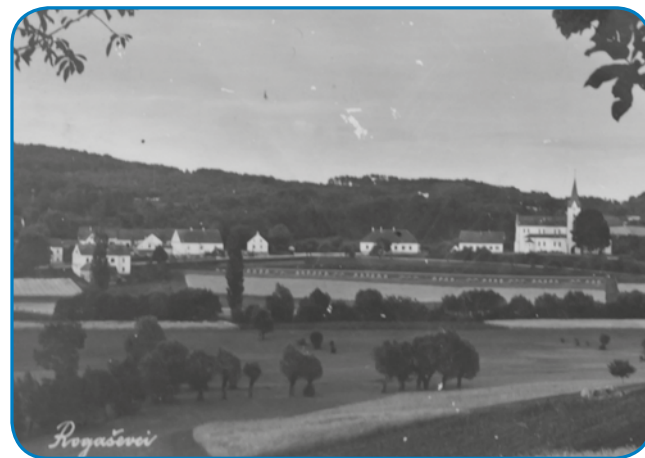
Razglednica, na steroj so Rogaševci leta 1941

»Tau so materi poslali leta 1941 iz Rogaševca, dapa tau se ne vidi dobro, ka sto go je pos-