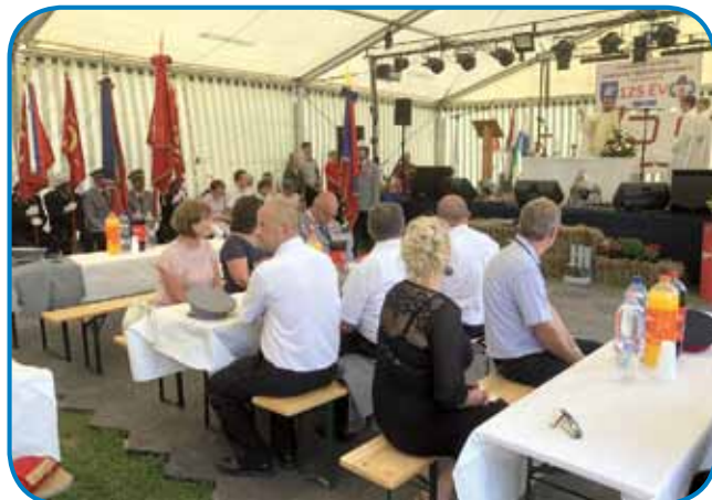
V velikem šotoru na športnem igrišču se je slavlje začelo s sveto mašo

stiski. Mašnik je obenem izpostavil pomen čezmejnega sodelovanja gasilskih društev. Svečanost se je nadaljevala z nastopom malčkov iz domačega vrtca. Ti so oblečeni v rdeče gasilske majice deklamirali madžarsko pesmico o malih gasilcih, ki želijo postati podobni očetom. Nato je pred-