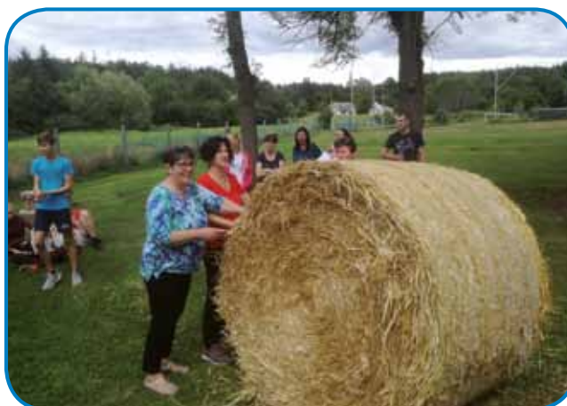
Upokojenke z ogromno balo slame

Sakalovska slovenska samouprava je že petič organizirala tako imenovano kmečko olimpijado. Njen namen je tudi, da bi mladi spoznali kmečka opravila svojih prednikov. Ročna orodja in ročno delo so bili del vsakdanjega življenja na kmetijah, na katerih je v prejšnjem stoletju živela večina porabskih Slovencev.