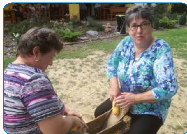
NAJBOLJE VRTALI, ŽAGALI IN LUŠČILI MLADI FOLKLORISTI stran 5