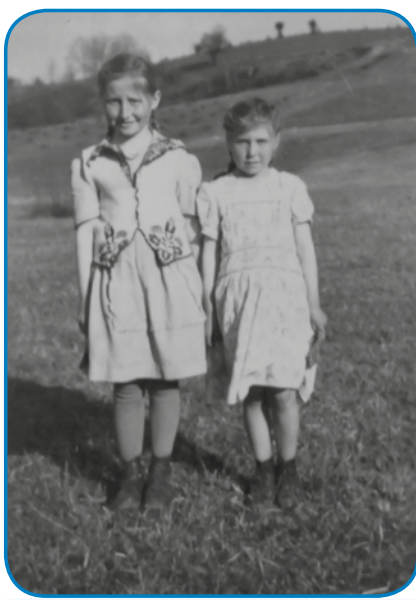
S sestrov pod brgaum, steroga zdaj že gauška pokriva

»Tau je še pred bojnov bilau leta 1943, v Čakovci (Csáktornya) se je tjepp redo, gda so ranč na straži bili. Tau