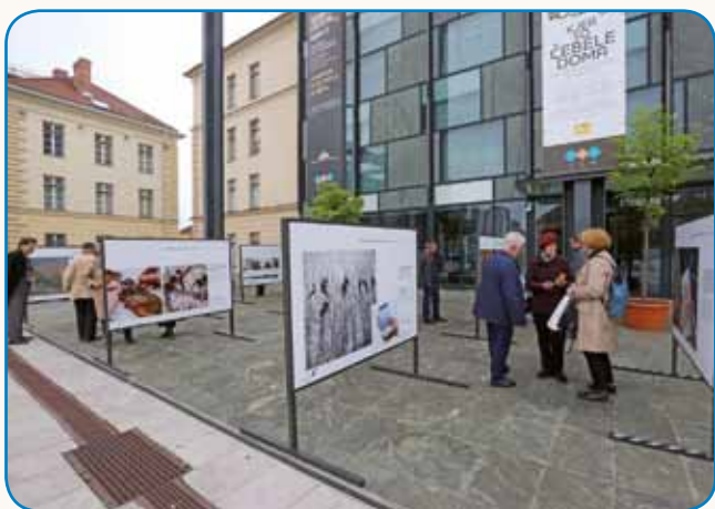
PRIHODNOST TRADICIJE stran 3