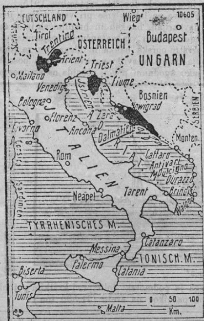
Die Wünsche Italiens.

Zahrbtni besedolomci v Italiji so poleg tega tako prevzetni, da se zdijo njih želje celo trez-