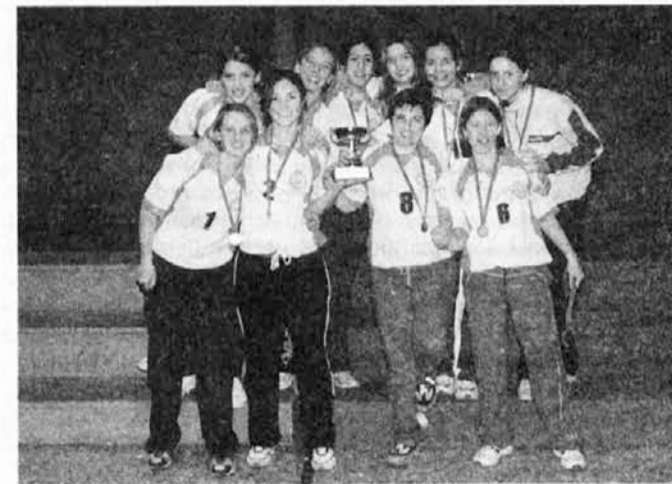
Zmagovalke SDO iz San Justa

Da sta ti dve ekipi gotovo med najmočnejšimi v naši sredi, dokazuje dejstvo, da sta zasedli tudi prvi mesti v zadnjem turnirju na