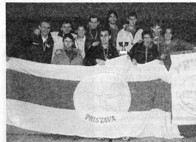
Zmagovalci SFZ s Pristave

mladinskem dnevu v San Martinu. Vsem nastopajočim, pa tudi vsem, ki so pomagali pri organizaciji čestitamo za lepo izvedbo. MTO je že postal tradicionalen v naši skupnosti. Torej, nasvidenje prihodnje leto.