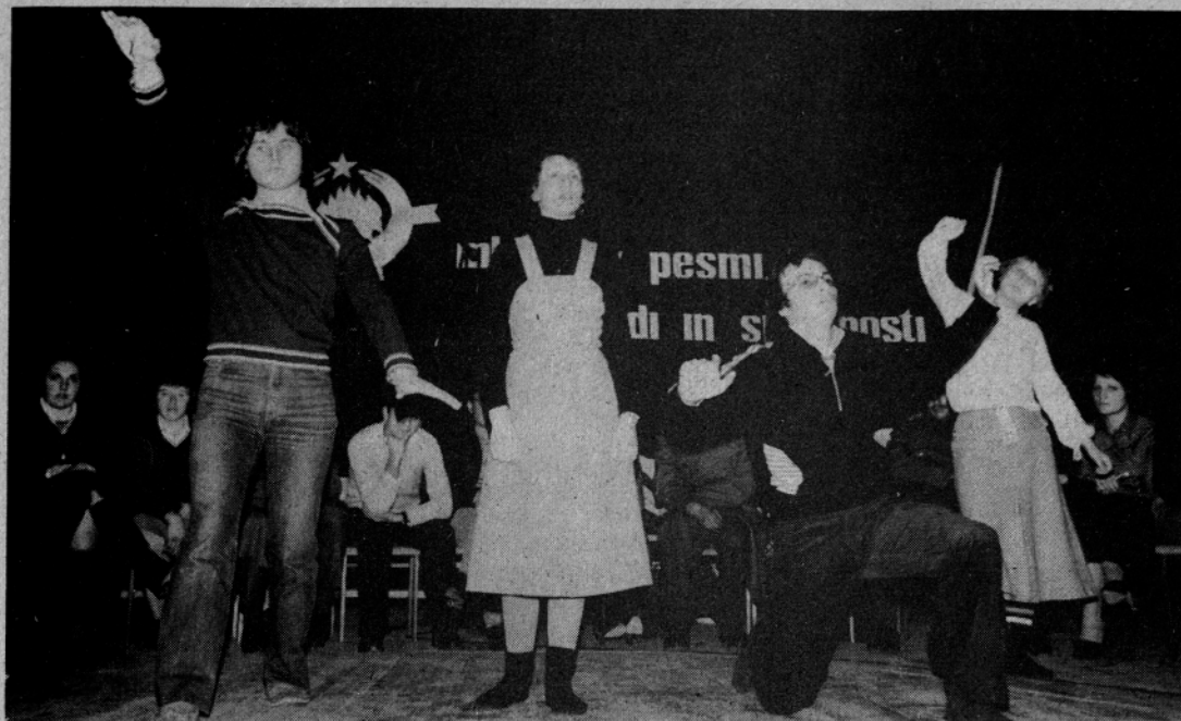
„REČIŠKE CIME“ v elementu na kvizu v Gornjem gradu