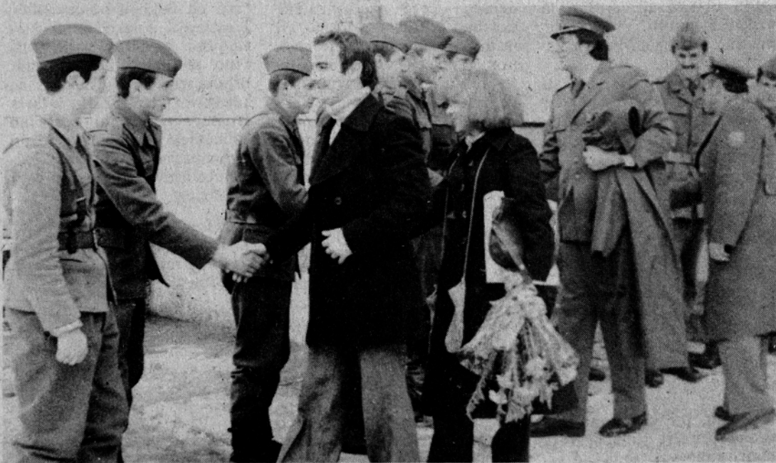
Ob dnevu JLA smo obiskali naše graničarje v karavlah.