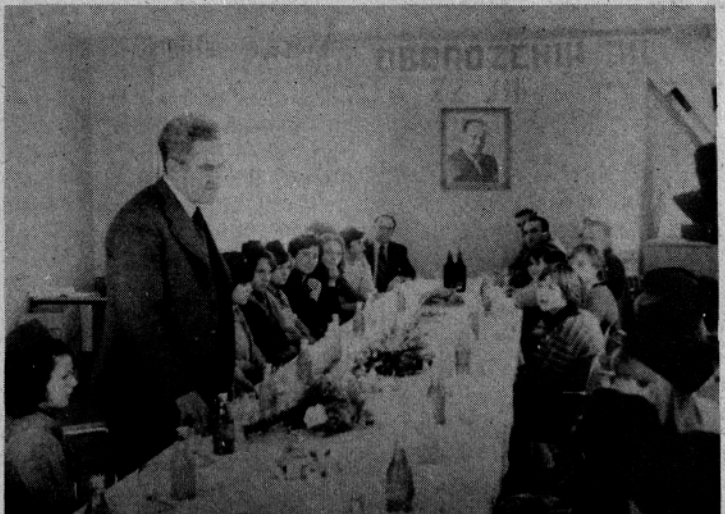
Predsednika občine in ZRVS Mozirje sta sprejela otroke osnovnih šol za dan JLA

Kolektiv Kovinarstva je pokrovitelj šole in rad kaj primarne, če je to potrebno! Tudi rastlinjak za potrebe šole bodo izdelali, pa še marsikaj namenjajo v dobro vzgoje najmlajših. V Kovinarstvu pravijo, da želijo tesno sodelovati s KS in drugimi organizacijami v kraju, saj se zavedajo nujnosti družbenega prepletanja interesov. Pa še to, če kaže, odkupijo predstvo ali koncert domačega društva in omogočijo brezplačen vstop svojim delavcem.