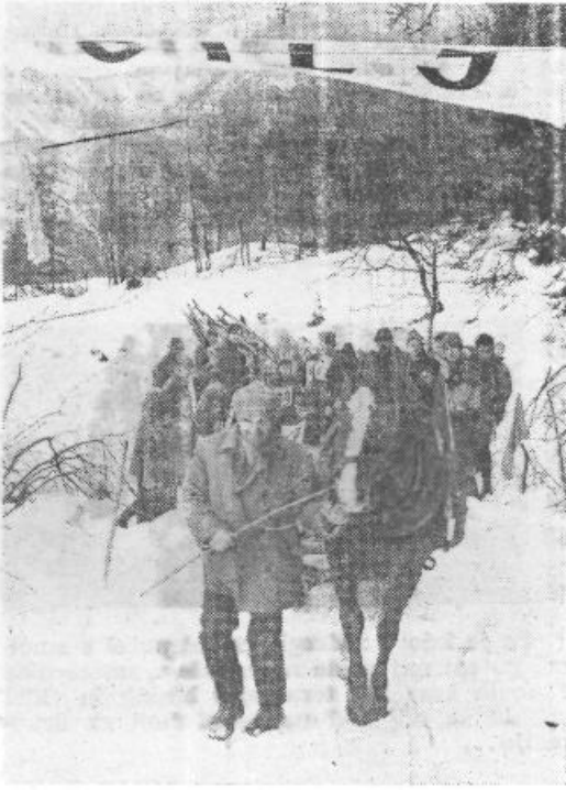
Tako, pa smo privlekli do cilja. Pravijo, da bodo strmine v prihodnjem letu še hujše...