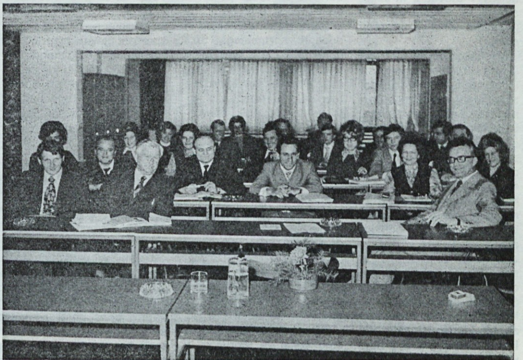
Udeleženci seminarja za sindikalne delavce v Emoni so se zbrali v Škofji Loki

Velik napredek je dosegla tudi poslovnica pijač. Skupno z vodstvom maloprodajne mreže smo določili asortiment in s tem dosegli večjo ekonomiko poslovanja. Tudi na področju alkoholnih in brezalkoholnih pijač imamo sklenjene dolgoročne pogodbe.