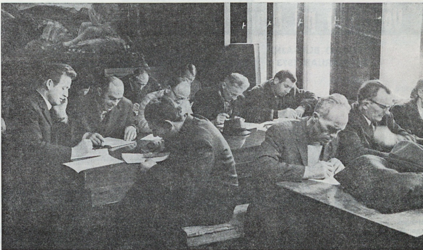
Zaščititi proizvodnjo in delavce je pomembna naloga civilne zaščite

V specializirane in univerzalne enote civilne zaščite je sedaj v podjetju vključenih 592 članov.