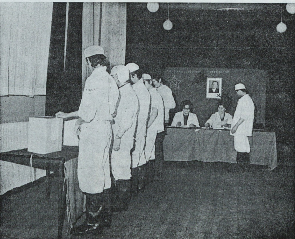
Volišče v Mesni industriji Zalog