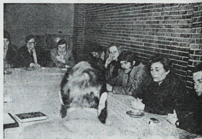
Mladi s seminarja spremljajo predavanje