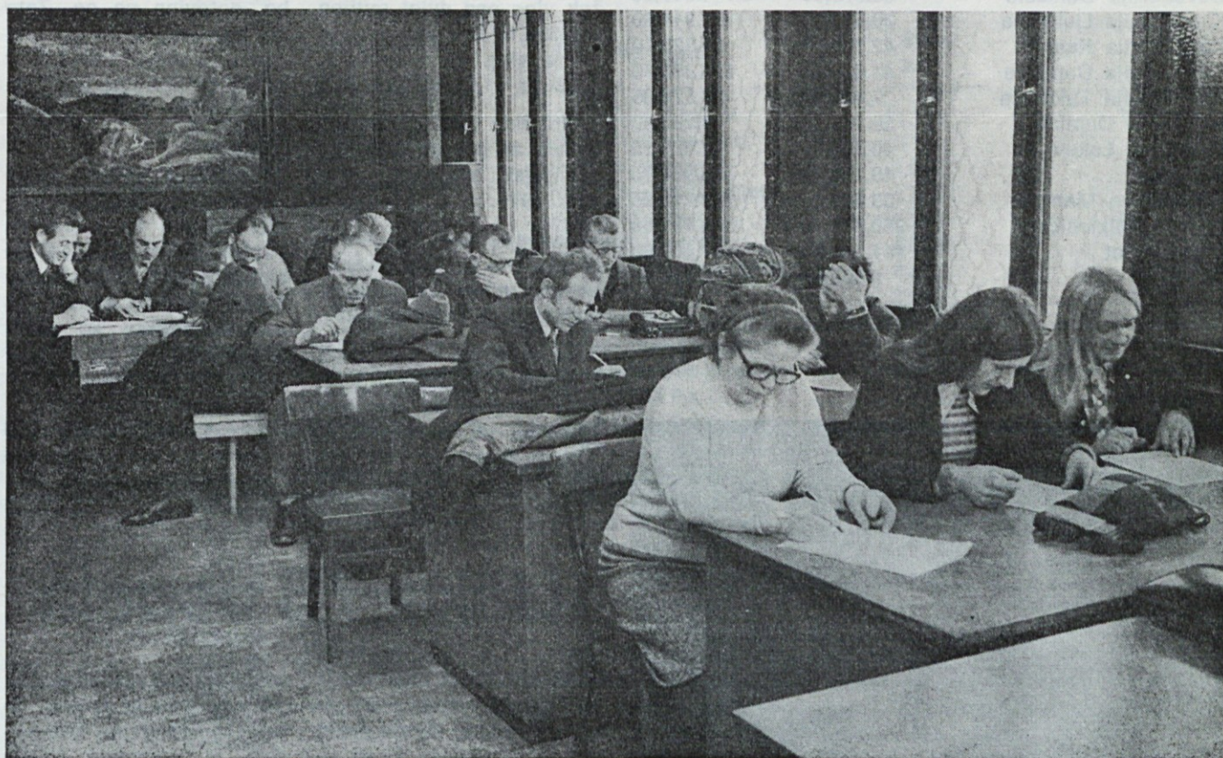
Na koncu je treba še preveriti znanje članov civilne zaščite, ki so obiskovali tečaje