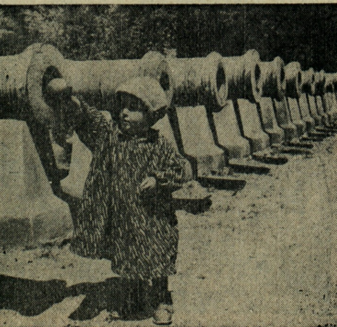
IZ NEKDANJH DNI — V Carigradu v Otomanskem muzeju je postavljena vrsta starih topov nekdanje turške armade. Deklica bi menda enega rada pripravila za strel?

tranjo hvalno pesem: ena je priletela k oknu, skozi katero je vsako jutro gledala prijazna deklica in sipala drobtinice drobnim krilatcem. "Cib, cib, cib," je kljuvala na okno in prosila; toda danes se nihče ne gane, nikogar ni k oknu. Notri v sobi je mrzla in blede ležala deklica na svojem revnem ležišču, in njene roke so ji sklenjene počivale nad prebodehim srcem... spala je in spala in se ni prebudila. Dve rumeni sveči sta gorili in se kadili poleg mrtvaškega ležišča. Mati, ki je na svojih rokah gori prinesla svoje dete in je položila na posteljo, je vsa zlomljena sedela ob njeni glavi. Cele ure je že prejkala in prepila, sedaj ne more več. Le tuintam zajeclja ime svojega otroka, li sveta imena, potem zopet nemo sedi kakor okamenela od boli in bridkosti.