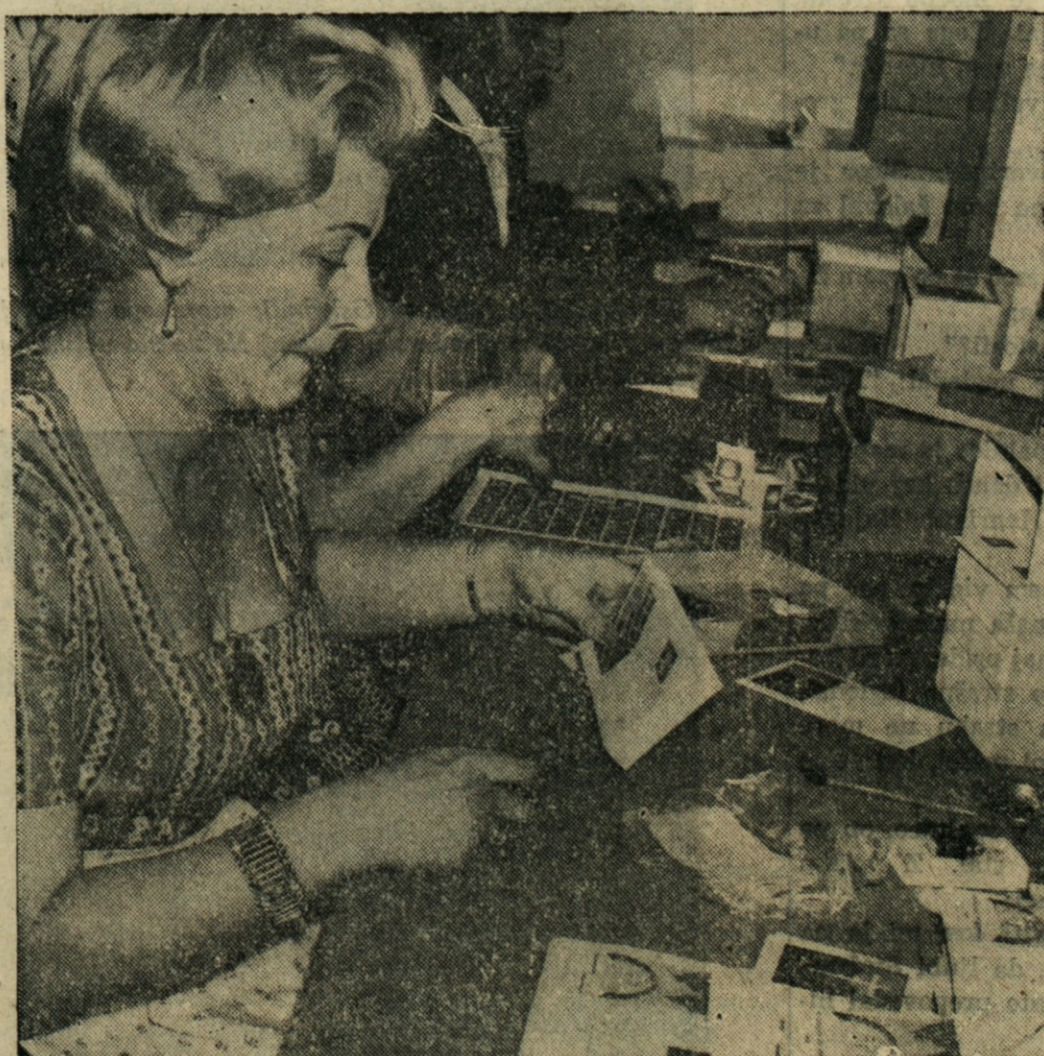
POSEL GRE DOBRO OD ROK — Na pošti v Oberammergau na Bavarskem lepijo na kuverte posebne jubilejne znamke za pastjónske igre, ki se vrše vsako deseto leto. Letos so se začele v maju in bodo trajale do jeseni. Na največji obisk računajo sredi poletja.

Prijatelj's Pharmacy SLOVENSKA LEKARNA Prescriptions — Vitamins First Aid Supplies Vogel St. Clair Ave in E. 68 St.