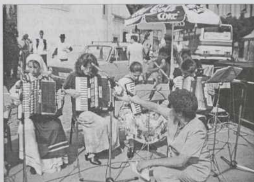
Seniški mali fudaške

23. avgustuša smo meli lejpi den v Mosonmagyaróvári. Vrejmen je dobro