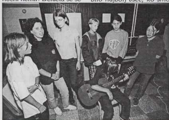
Otroci s Koroške na zaključni prireditvi.

kar dobro razumemo in se nekatere tu pa tam tudi sprickajo. Pokrajina tu okrog je zelo lepa, okrog študentskega doma imamo lep gozd, v katerega hodimo na krajše sprehode.