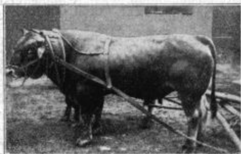
Slika 40. Glavni plemenjak. Selekcijska zadruha v Ribnici.