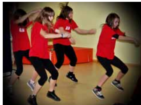
AIA v vrtcu Češmin ...