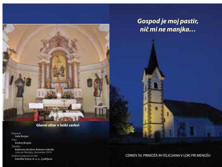
Glavni oltar v loški cerkvi