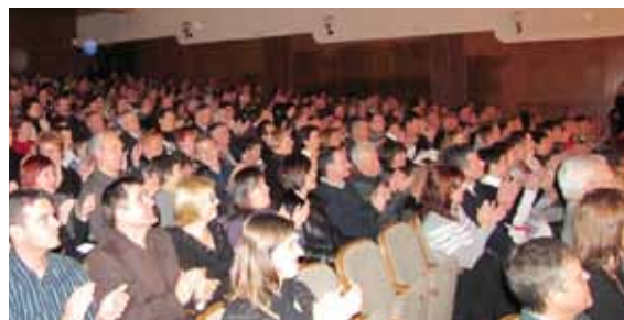
Polna dvorana kulturnega doma