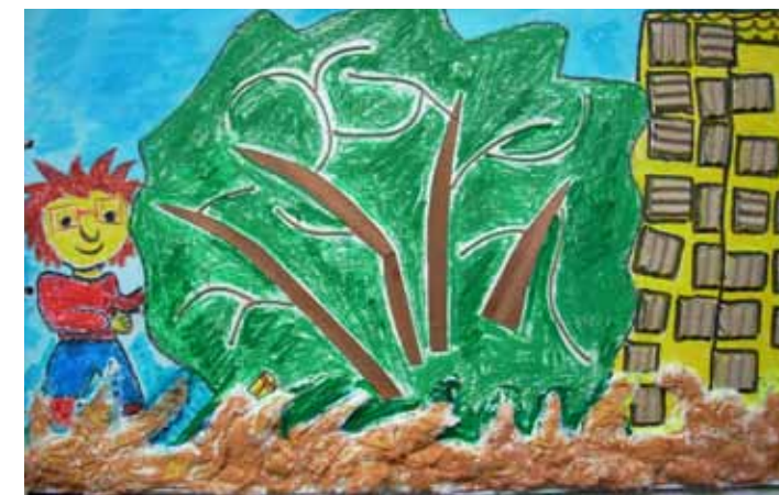
Jure je našel vžigalnik.

Evropska komisija je izdala odločbo, s katero je prepovedala prodajo vžigalnikov, ki nimajo zaščite za otroke, in vžigalnikov, ki so po izgledu ali obliki (v obliki igračk, mobilnih telefonov, hrane ...) še posebej zanimivi za otroke. Od 11. 3. 2007 velja prepoved uvažanja, dajanja na trg in prodaja takšnih vžigalnikov. Za tak ukrep se je Evropska komisija odločila, ker napačna raba vžigalnikov pri igri otrok lahko povzroči hude nesreče. Samo v EU prihaja letno do med 1.500 in 1.900 poškodb (od tega med 34 in 40 s smrtnim izidom) zaradi nesreč, ki jih pri igri z vžigalniki povzročijo otroci.