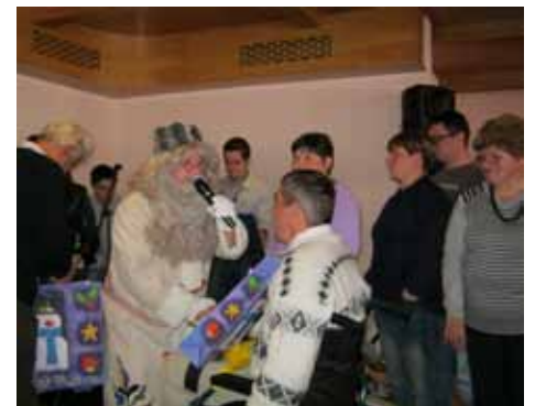
Dedek Mraz je obdaroval člane društva.