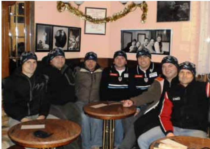
Povsem sveži kandidati za ocenjevalne sodnike

Za konec meseca pa vsi stiskajmo pesti, da bo narava tako dobrohotna in bo namenila primerne vremenske pogoje za organizacijo že 13. memoriala, v spomin na ponesrečene pri