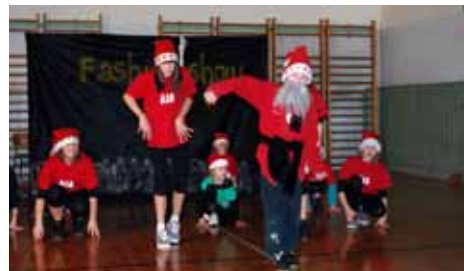
... na božično novoletnem nastopu ...