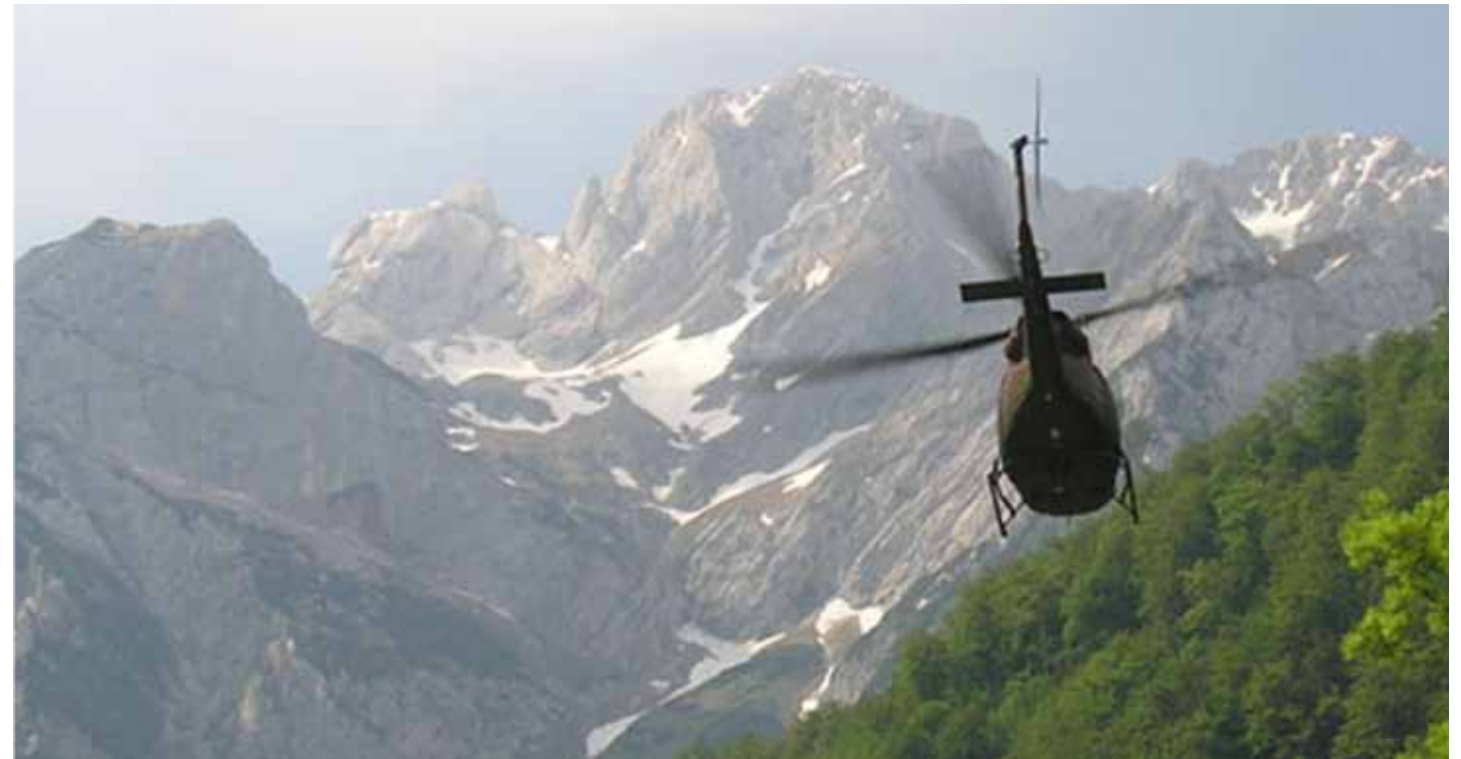
Helikopter je v veliko pomoč

Planinci so tisti, ki se v gorah ukvarjajo z planinsko dejavnostjo, kot je npr. hoja po poteh, plezanje, alpsko in turno smučanje. Ostale dejavnosti, ki se izvajajo v gorskem svetu ali na težko dostopnem terenu in jih v primeru nesreče rešujejo gorski reševalci, pa so zračne aktivnosti, jadrnanje s padali, soteskanje, dela v gozdu, gorsko kolesarjenje, sankanje ipd.