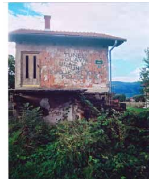
Hiša z muzejem in vhod v tunel, ki je prebivalcem Sarajeva v vojni omogočil preživetje.

V Sarajevu smo si najprej ogledali staro mesto – Baščaršijo, Bogovo Džamijo, Mestno hišo, Principov most. Naslednji dan smo se iz našega hotela Hollywood odpeljali proti prelazu Ivansedlo do