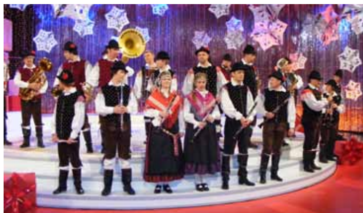
Na snemanju Silvestrskega Videomeha