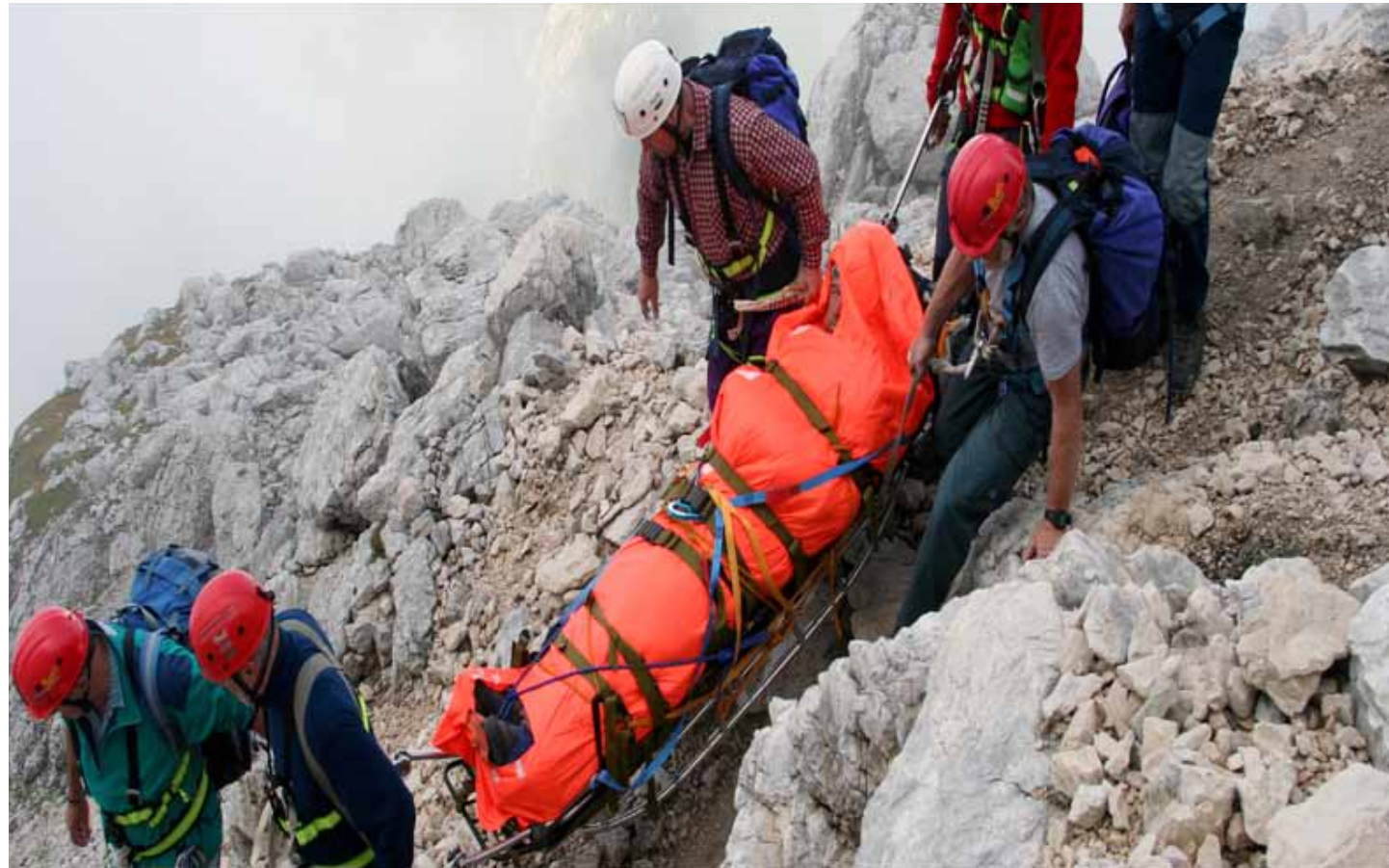
Klasično reševanje vzame veliko časa in moči.

Za vzpone nad gozdno mejo uporabljamo čevlje s tršim podplatom in dereze z 12 zobmi, ko ocenimo, da bi se ob možnem zdrsru ne ustavili varno, pospravimo pohodne palice in v roke vzamemo cepin. Dereze in palice so nevarna kombinacija.