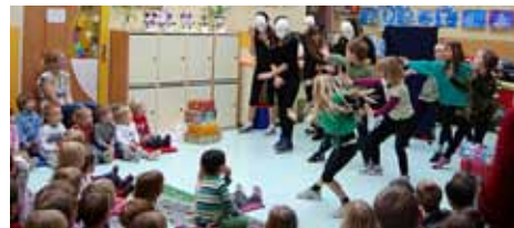
... in v vrtcu Sonček.