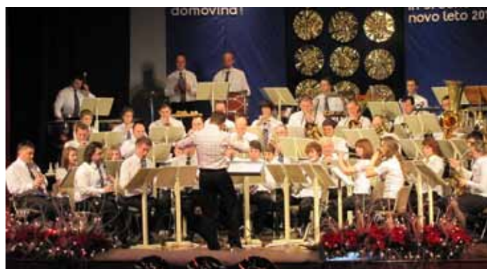
Tradicionalni novoletni koncert