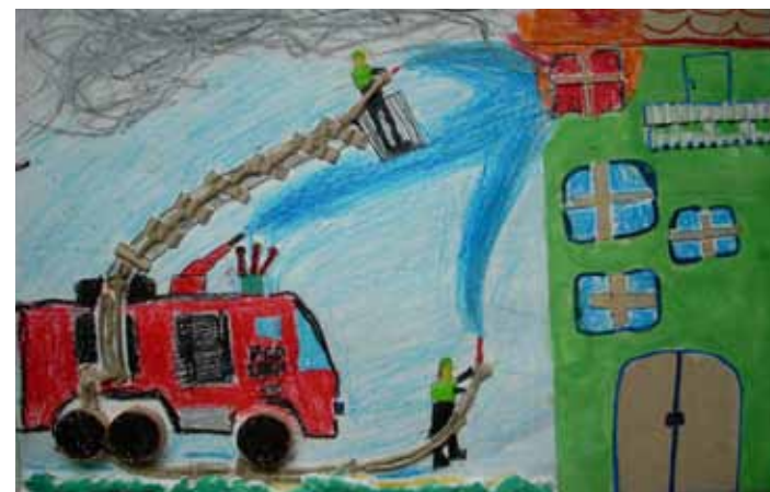
Gasilci so prihiteli.

Nagrajeno zgodbico meseca požarne varnosti so napisali in ilustrirali učenci 5. b razreda pod vodstvom mentorice Nade Javh.