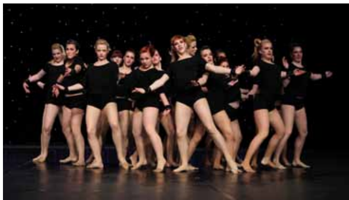
Z Love symphony do drugega mesta