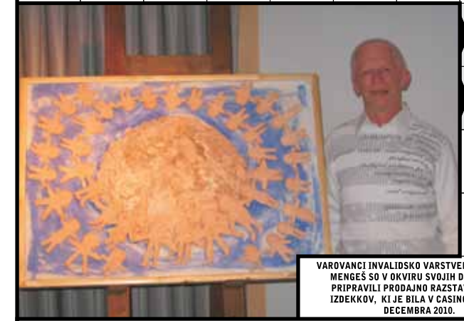
VAROVANCI INVALIDSKO VARSTVENEGA CENTRA MENGEŠ SO V OKVIRU SVOJIH DEJAVNOSTI PRIPRAVILI PRODAJNO RAZSTAVO SVOJIH IZDELKOV, KI JE BILA V CASINOJU LESCE DECEMBRA 2010.

Rešitev decemberske križanke: NONI, SRT, VESEL BOŽI, OTRINJAČ, BAAR, DA, AŠ, KIAR, SREČNO V, NOVEM LETU, VIDEOTEKST, ARAT, INVALID, KROŽKAR, AGENTKA, ITA, ALG