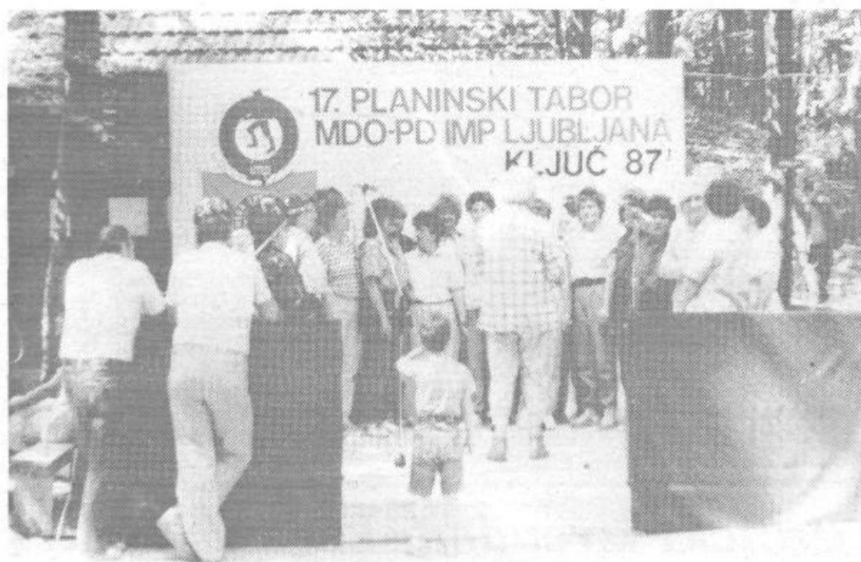
S 17. PLANINSKEGA TABORA NA KLJUČU