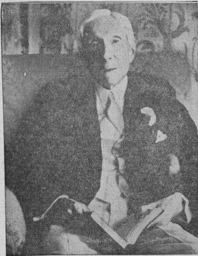
John D. Rockefeller, "kralj" petro lejskih vrelcev, je obhajal svoj 97. rojstni dan