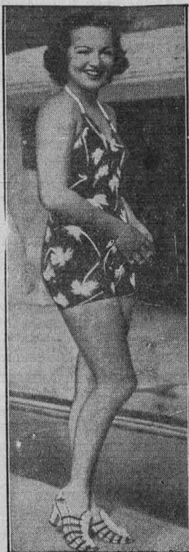
Arline Judge filmska igralka, ki je bila proglašena za najpopolnejšo žensko med svojimi sovrstnicami