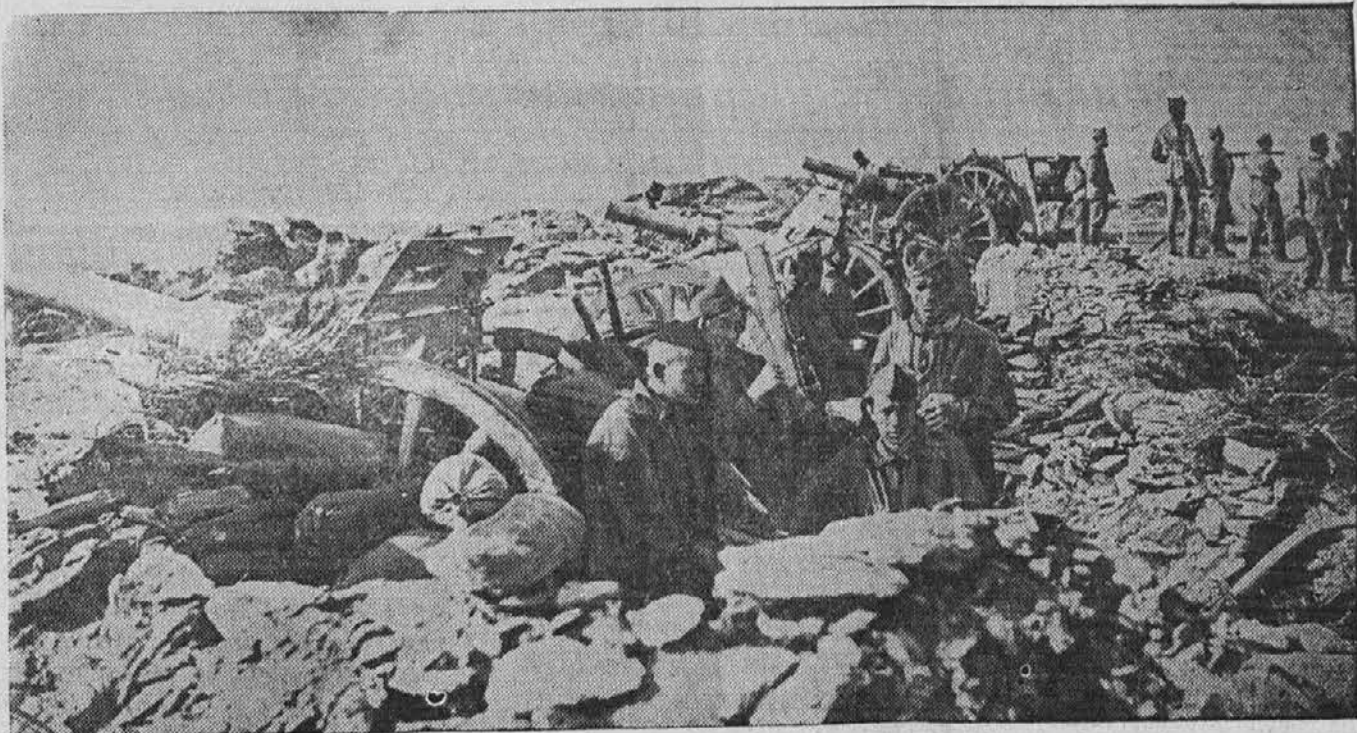
Pri Talaveri de la Reina je dala vlada napraviti močne utrdbe, da zaustavi prodiranje revolucionarcev proti Madridu. Na tej fronti poveljuje vztašem gen. Franco.

Vsi, ki smo le par let imeli priliko za učenje na ljudskih šolah (če se nismo kot neugnani paglavci potikali, za časa pouka, po grmovju