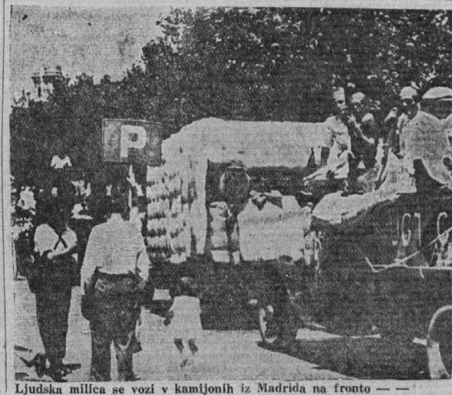
Ljudska milica se vozi v kamjionih iz Madrida na fronto —