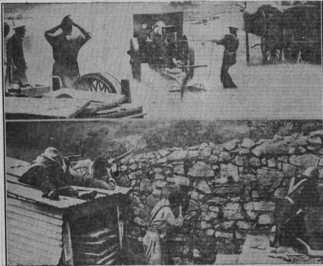
Slika iz sedanje državljanske vojne v Španiji. Ustaška artilerija strelja. Spodaj se vladni pristaši branijo za barikadami

O Huesci so že javili, da jo je zasedla ljudska milica, vendar pa ta vest ni bila potrjena; Ovi- edo napadajo asturski rudarji s povečano silovitostjo in trdnjava Alcazar, v Toledu, bo kmalu kup razvalin. Vladno topničar-