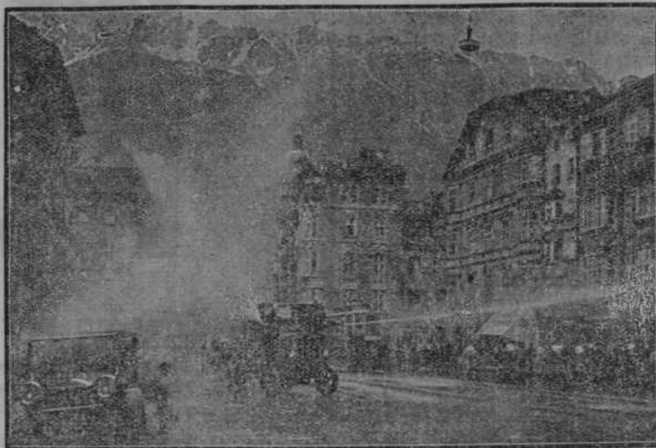
V Innsbrucku razganja policija hitlerjevske demonstrante proti avstrijski Dollfussevi vladi z motornimi brizgalnami.