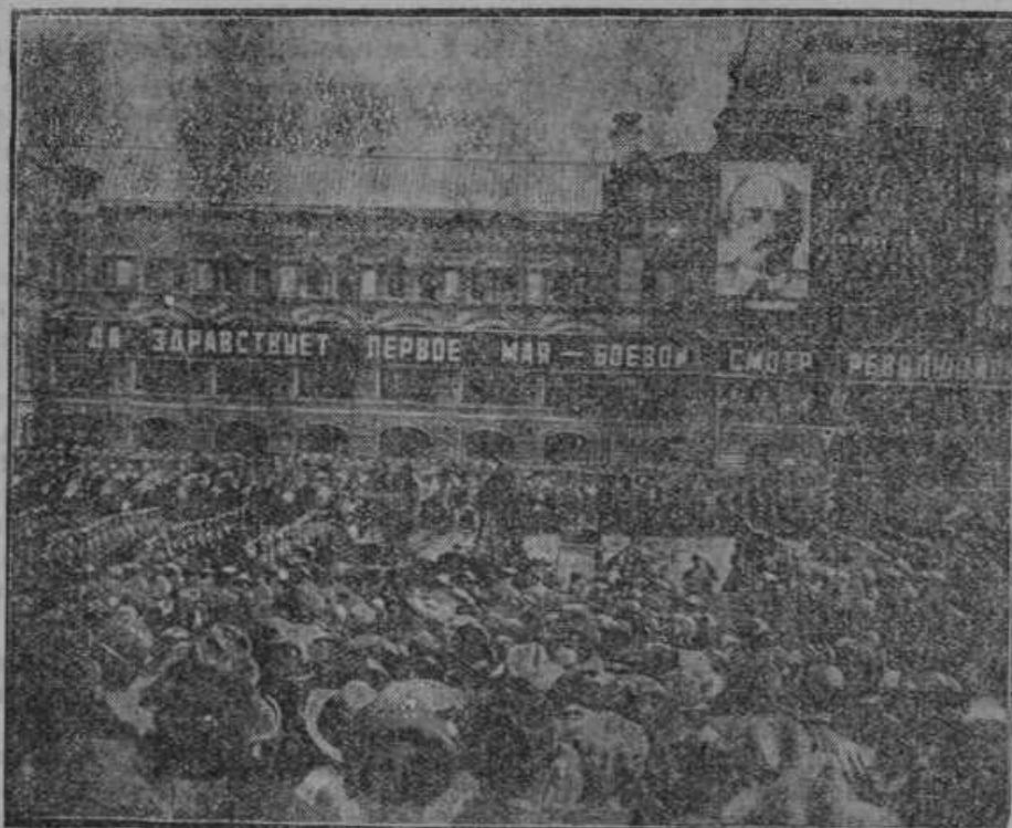
Proslava 1. maja v Moskvi. Parade čet na Rdečem trgu.