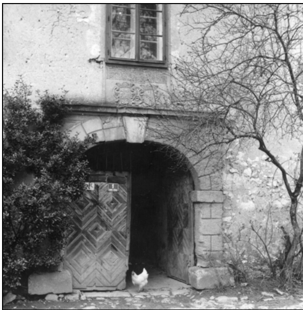
Portal dvorca leta 1983.