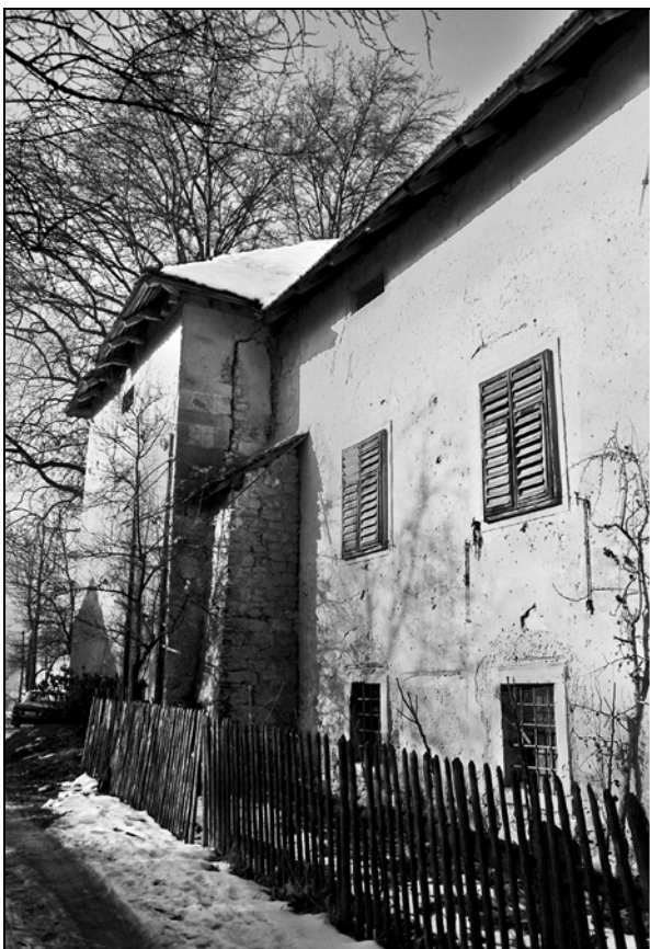
Jugovzhodno pročelje dvorca z lesenim plotom leta 1971.

Zasnova vrta ob dvorcu je bila tudi v 19. stoletju preprosta. Ob osi, ki je naravnana od sončne ure na jugovzhodni fasadi dvorca proti jugu, je razporejenih deset parternih polj, pet na vsako stran. Zadnje, enajsto polje ni deljeno in je zaradi prilagoditve terenu trikotne oblike. Na stiku posameznih polj so bila zasajena sadna drevesa. Ureditev se je zaključila s sadovnjakom pravokotne oblike.