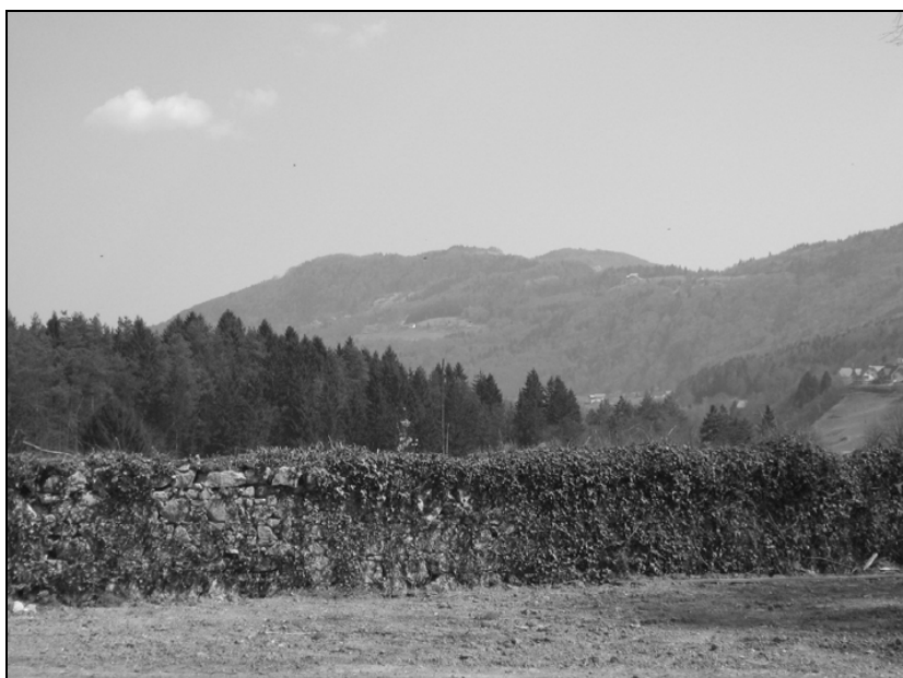
Ohranjeno obzidje na vzhodnem robu nekdanjega vrta, v ozadju pogled na Katarijo in cerkev sv. Nikolaja.