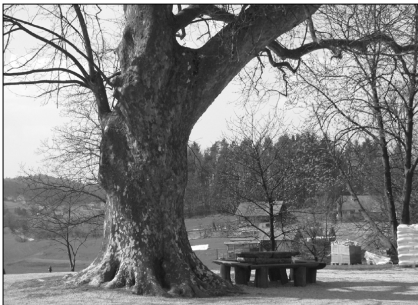
Platana s kamnito mizo.