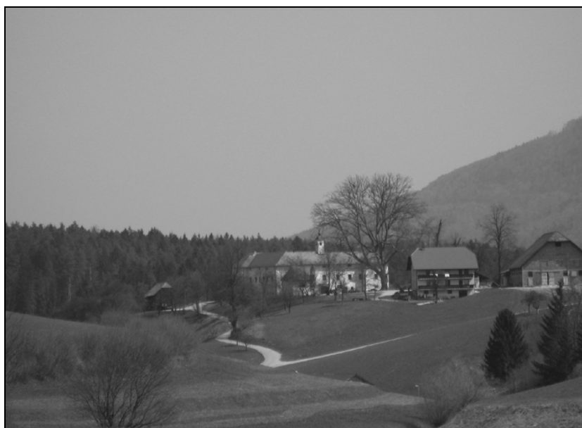
Pogled na dvorec Tuštanj z zahodne smeri.

Kakšen je bil videti dvorec z dvoriščne strani na začetku 20. stoletja, vidimo na reprodukciji iz risanke Herberta Kartina iz leta 1913. Takšno podobo je ohranil do 80-ih let prejšnjega stoletja. Pred vhomom v kapelo sta rasli dve pacipresi, po ena na vsako stran vhoda. Ob portalu pred vhomom v dvorec je bil zasajen grm trdoleske. Ob jugovzhodni fasadi je bil med dva vogalna izzidka in dostopno pot stisnjen manjši vrtiček, obdan z lesenim plotom. Kakšen je bil videti vrt v tem času, ni mogoče reči. Sklepamo lahko, da okrasne funkcije ni imel več. Če je še v 19. stoletju zasnova vrta nakazovala težnjo po oblikovanju parkovne površine, v 20. stoletju to ni bilo več aktualno. Kmetijska raba zemljišč in gospodarskih objektov v neposredni okolici je terjala svoj davek.