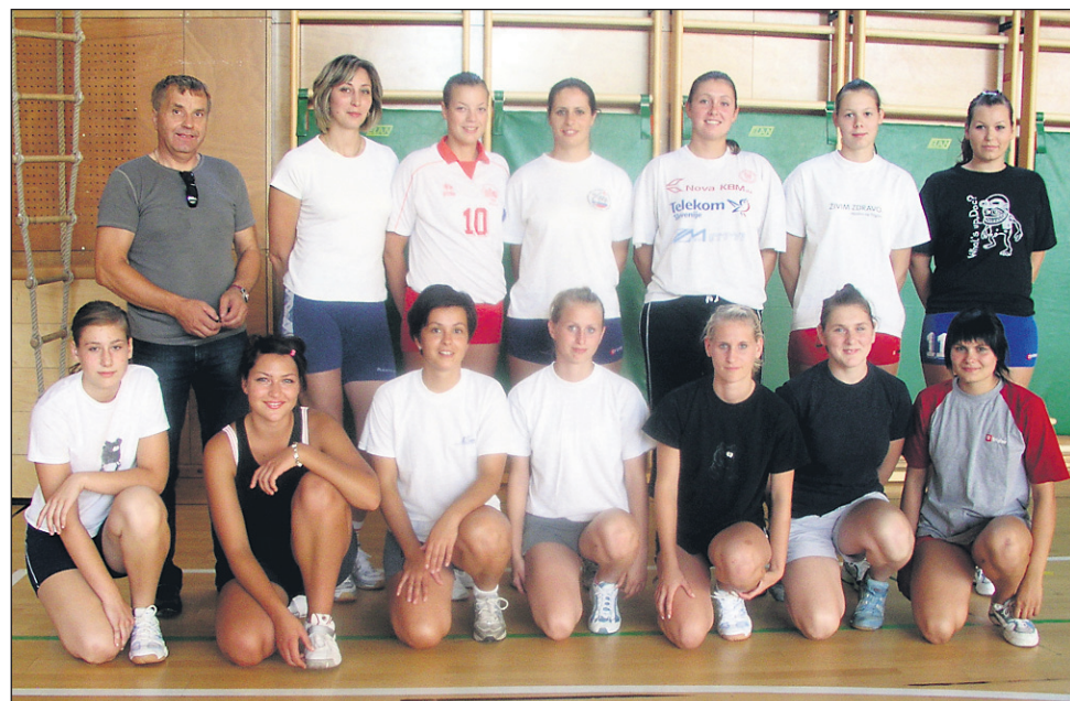
Odbojkarice MTD Ptujja ciljajo na 1. mesto v 2. slovenski ligi