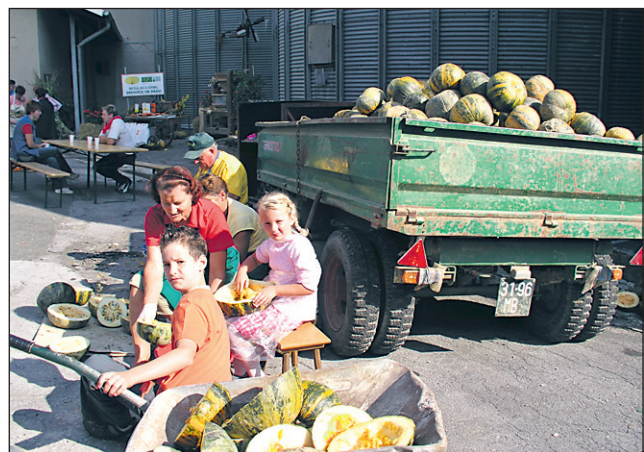
Kdor je želel poizkusiti, se je lahko tudi sam preizkusil v trebljenju buč.