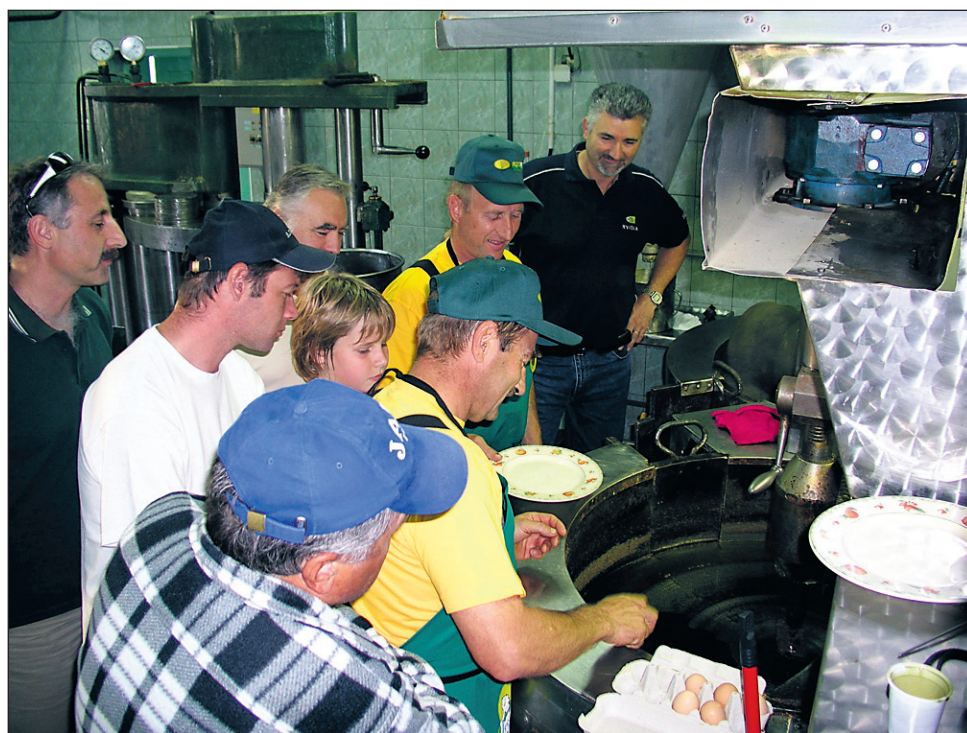
Veliko zanimanje je bilo tudi za ogled načina praženja bučnic in stiskanja olja. Zaposleni so postregli tudi s posebno specialiteto – jajci na oko praženimi na bučnem olju.