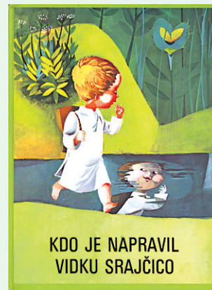
KDO JE NAPRAVIL VIDKU SRAJČICO