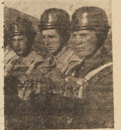
Resno in napeto čakajo padalci na start...

Ne vem, koliko časa se gledava. Izgubljen je in njegove široke od-