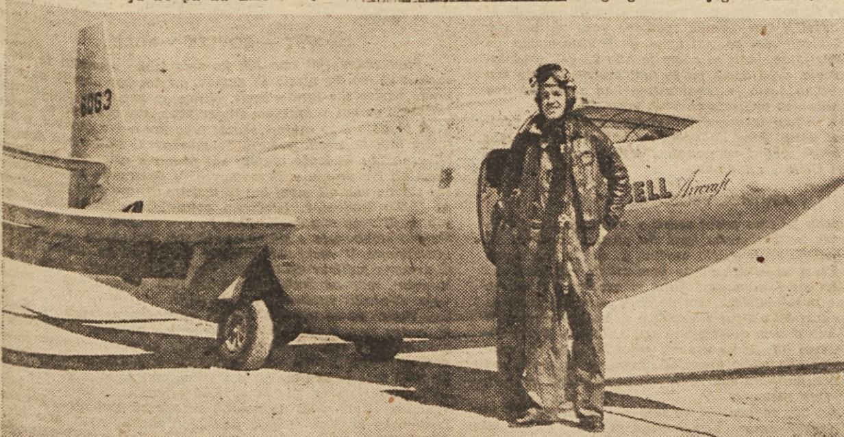
Charles Yeager pred raketnim letalom Bell X-1, ki je prvo letelo hitreje od zvoka

Pač, odpovedali so, vendar le za 358. eskadriljo našega polka. Torej bo naših lovec dvajst manj. Pokroviteljsko se nama je »Staric« nasmehnil: »Brez skrbi, vrtnitev bo tako krila 361. skupina — zamenjala vaju bo pa na nizo-