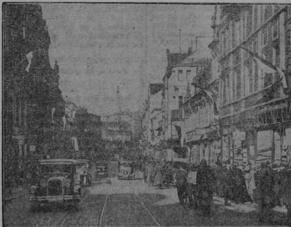
Nemško mesto Neunkirchen pred plinsko eksplozijo.