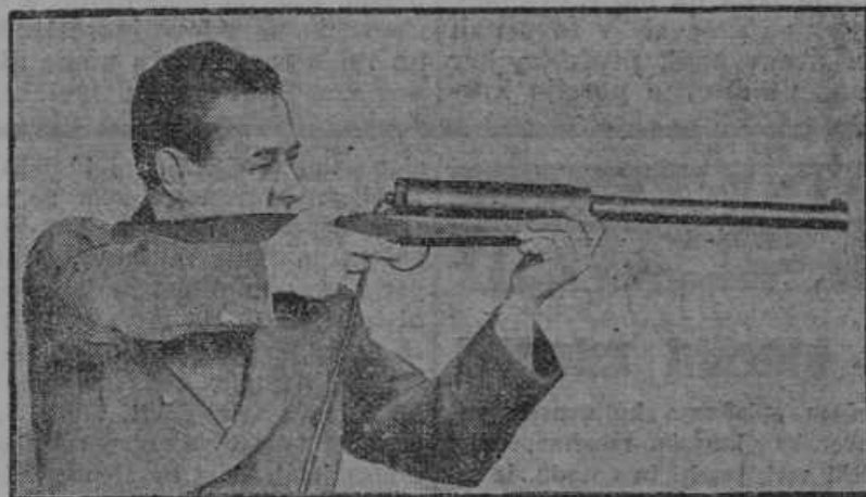
Angleški častnik je iznašel električno puško, ki ne dela ropota in pri streljanju ne širi nobenega duha.

V celi južni Rusiji — v Ukrajini, ob Donu, ob Kubanu in na severnem Kav-