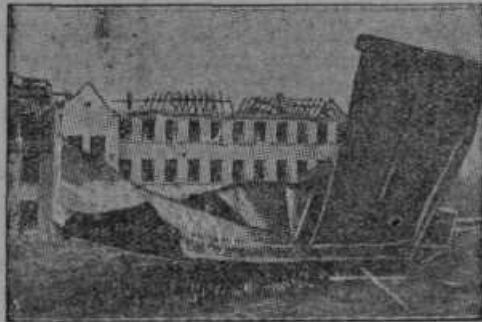
Slike iz strašnega razdejanja v nemškem mestu Neunkirchen, katerega je povzročila eksplozija plina, o kateri smo poročali v zadnji številki.