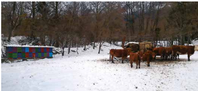
Stojišče na pašniku

sintetičnih učinkovin ali na bazi naravnih učinkovin, je najučinkovitejše takrat, ko v panju ni prisotne pokrite zalege. Z vprašanji, kako in s čim boste zatirali varoje, pa se obrnite na pristojnega veterinarja za čebele.