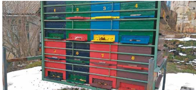
Izletni dan, čas za sublimacijo

Kot mentor čebelarjem začetnikom in krožkarjem vem, da je zaradi želje po nabiranju znanja in izkušenj čebele težko pustiti pri miru. Na stojiščih ta mesec nadzorujem samo delovanje električnega pastirja. Ko čebele ob izletnih dnevih razpustijo gručo, pa še preverim, če je slučajno kakšna družina propadla, da zaprem žrelo, tako da nimajo druge čebele vstopa v