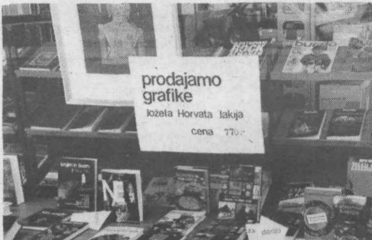
2. V Cankarjevi založbi nasproti trga prodajajo grafike Jožeta Horvata. Za nekaj kg radiča, še manj kg mesa dobite tudi lepo kulturno dobrino.