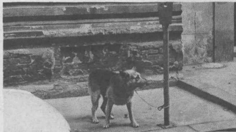
5. Ljubljanske parkirne ure so dobesedno na psul. Poglejte dokaz.