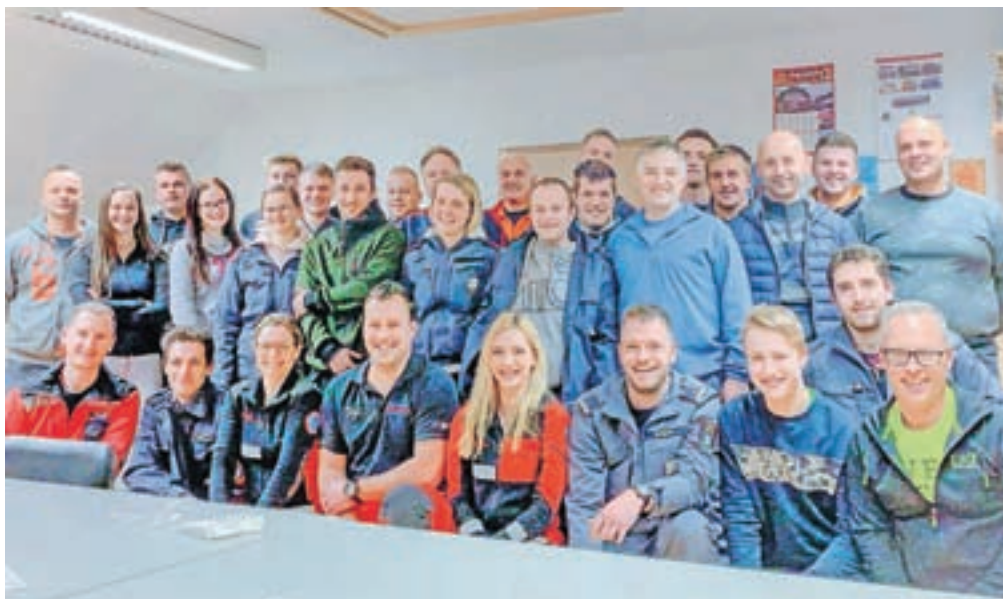
Prvi posredovalci iz Prostovoljnega gasilskega društva Gozd z ekipo iz Zdravstvenega doma Kamnik

Gozd – Člani in članice Prostovoljnega gasilskega društva Gozd smo v začetku januarja izpolnili še enega izmed ciljev, ki smo si jih zadali. Osmega januarja je 25 naših članov in članic uspešno zaključilo izobraževanje za prve posredovalce, ki so ga izvedli zaposleni Zdravstvenega doma Kamnik. S tem tudi gasilci PGD Gozd stopamo korak naprej in se pridružujemo nekaterim drugim gasilskim društvom v občini Kamnik in drugod po Sloveniji, ki imajo v svojih vrstah poleg operativne enote organizirano tudi ekipo prvih posredovalcev. Gre za sivi-