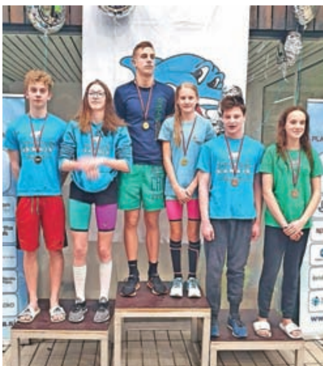
Mladi kamniški plavalci z medaljami z državnega prvenstva