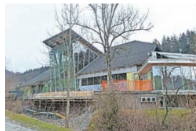
Gradnja prizidka za večnamensko dvorano že poteka. Končana naj bi bila do junija.

V osemnajstih letih neprekinjenega delovanja so Terme Snovik postale turistični ponudnik, ki v občini ustvari največ nočitev. V načrtu imajo še vrsto investicij – letos je na vrsti gradnja večnamenske dvorane, za katero bodo namenili pol milijona evrov.