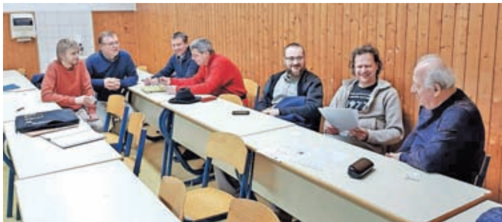
V bratskem razpoloženju in pomenku

Moč in pomoč, kako obvladati, kar se zgrne nanje, dvigniti glavo in iti naprej k