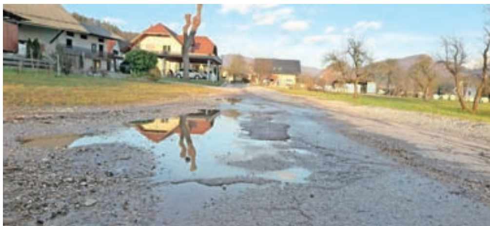
Cesta skozi Podgorje je dotrajana, a takšnih in tudi še slabših je v občini žal še precej.