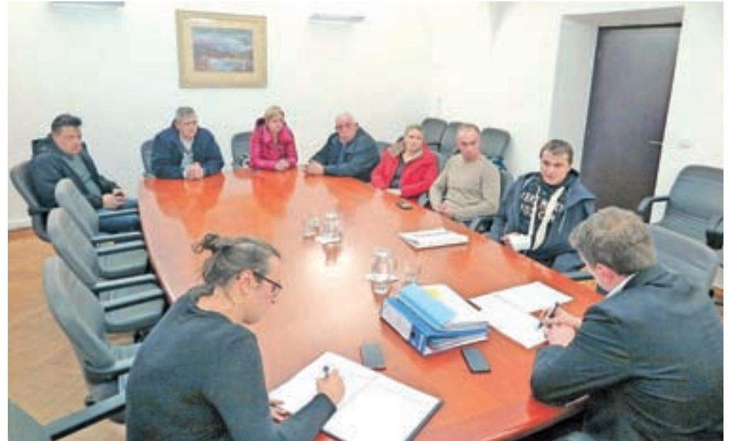
Člani Sveta Krajevne skupnosti Podgorje na sestanku z županom

»Pred časom smo bili s strani Občine Kamnik naprošeni, če jim pomagamo pri ureditvi podpisov glede izgradnje kolesarske ceste, ki naj bi potekala po podgorskem polju, kjer so večinski lastniki kmetije iz KS Podgorje. Občina bo tu uredila povezovalno kolesarsko stezo oz. cesto širine štiri metre, tako da naj bi imeli na podgorskem polju asfaltirano štirimetrsko kolesarsko stezo, skozi vas pa naj se vozimo po uničeni, že skoraj makadamski cesti. Za nas in za naše krajanje Podgorja je to nedopustno. Vztrajamo, da se najprej