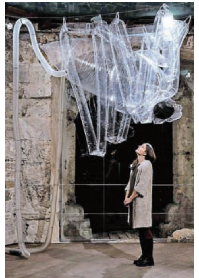
Ninina instalacija Ostani tako dolgo, kot želiš / FOTO: NADA ŽGANIK