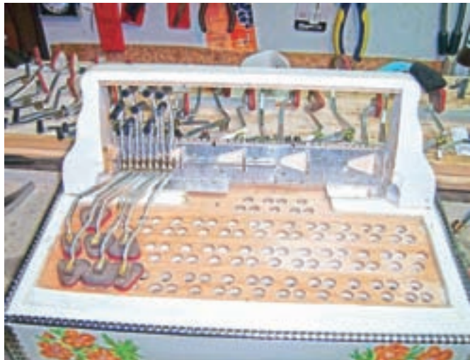
Z zanimanjem smo si ogledali, kako nastane harmonika.

blagovne znamke Goti. Goštitelj nam je pokazal materiale, različne deščice raznega lesa – zanimivih tekstur in barv. Ogledali smo si laserski razrez oz. oblikovanje posameznih delov. V naslednjem prostoru smo videli, kako sestavlja lesene izrezanine z jezički, tipkami in drugimi deli, da nastane glasbilo, ki je med glasbeniki zelo iskano in uporabno. Zahtevno in natančno delo z veliko vložene časa. Družina Goti je tudi glasbena družina, imajo celo družinski ansambel. Ob koncu obiska nam je Goti zaigral na har-