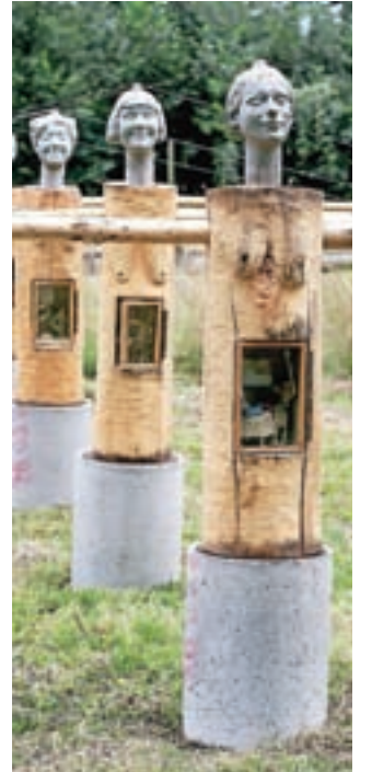
Poznavalcem umetnosti so v spominu ostale tudi Obsesije.

Za konec. Kamnik je od nekdaj veliko mesto. Veliko