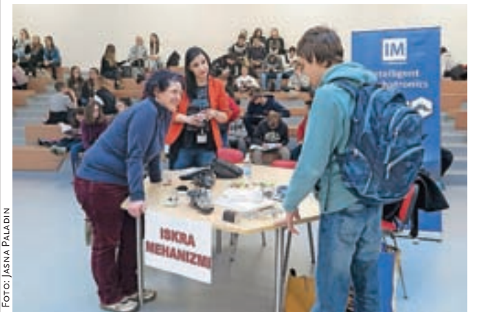
Podjetja na Karierni tržnici iščejo bodoče štipendiste in morebitne zaposlene, dijaki pa informacije o študiju.

Na Gimnaziji in srednji šoli Rudolfa Maistra Kamnik so že četrto leto zapored pripravili Karierno tržnico.