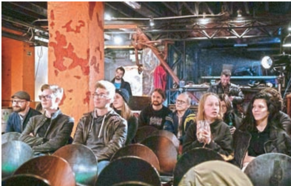
Obiskovalci 7. Festivala svobodne video produkcije so bili v Kotlovnici priča pravemu filmskemu maratonu.