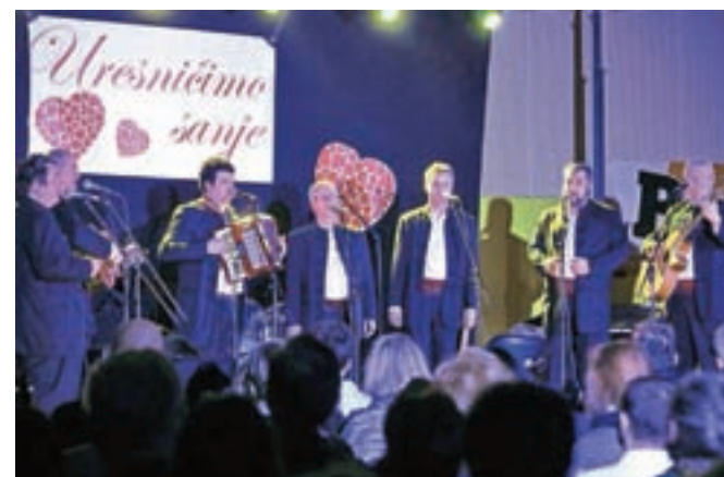
Med nastopajočimi na dobrodelnem koncertu je bila tudi Klapa Mali grad.

u in so vključeni v program PRP (Post rehabilitacijski praktikum). Zanje bodo zdaj lahko organizirali nekaj daljših izletov in delavnic, prav tako pa bodo z denarjem pomagali tudi drugim dijakom Ciriusa oz. njihovim staršem, ki zaradi socialnih stisk težko zmorejo plačati vse aktivnosti svojih otrok. Bogat program je letos v svojem stilu, ki gledalcev ni pustil resnih, povezoval Ti-