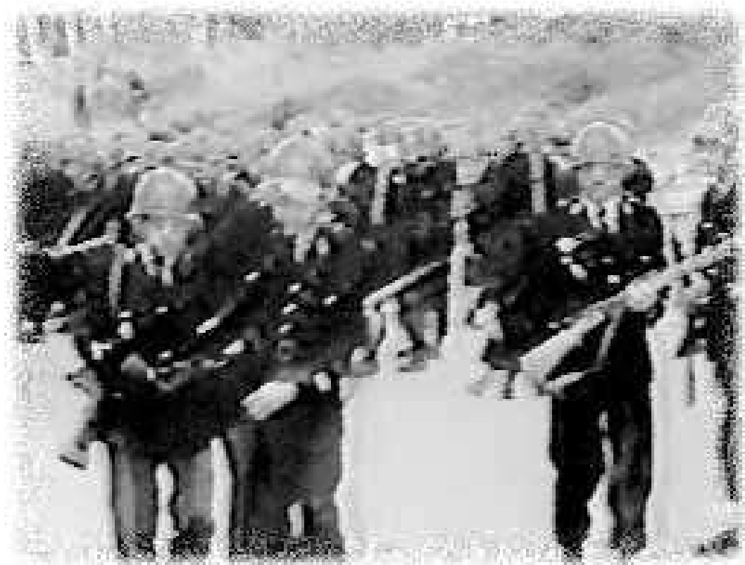
Guy Debord: Družba spektakla