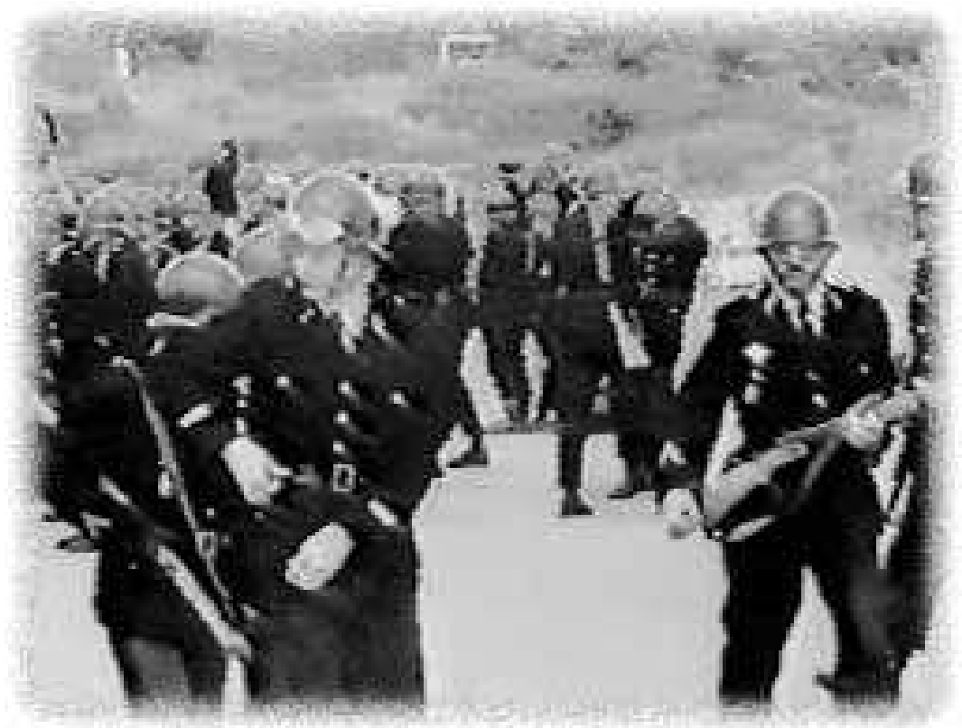
Guy Debord: Družba spektakla