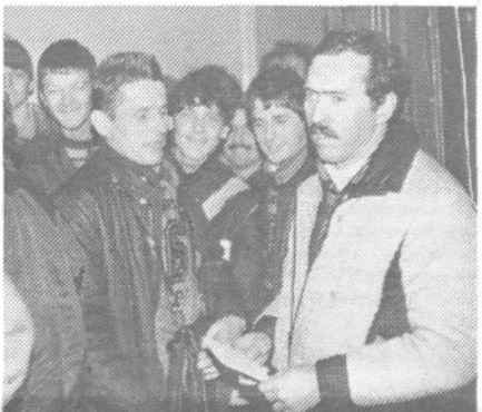
Viške rezervne vojaške starešine in mladinci čakajo, da bodo odšli reševati teoretične naloge

Letos je RK ZRVS ob pomoči RK ZSMS in v organizaciji občinskih konferenc ZRVS in ZSMS Radovljica ter