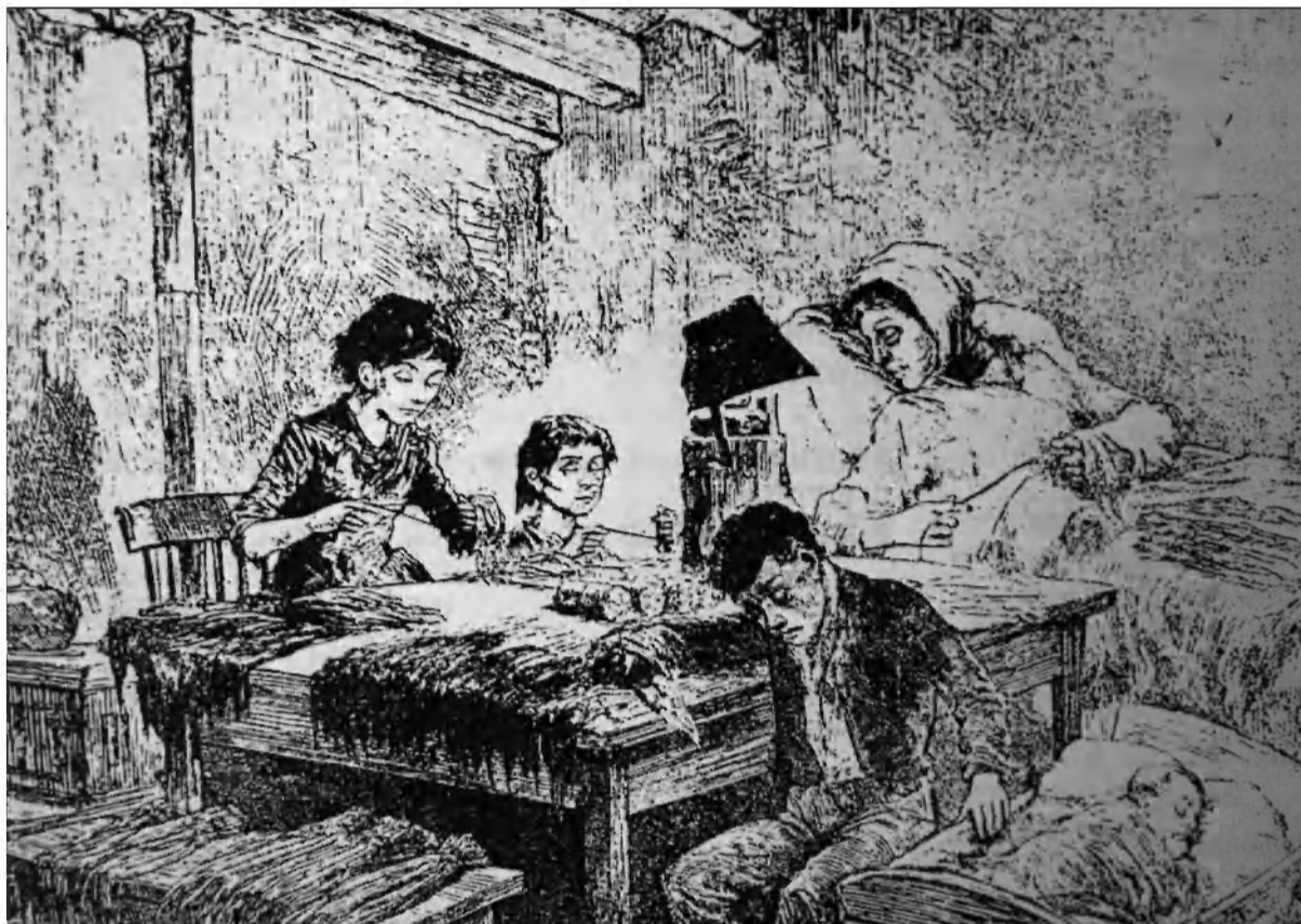
V revnih družinah so delali otroci tudi ponoči ob slabem brljenju petrolejk

jo pritožbe, da ima prezgodnja in pretirana uporaba otrok v tovarnah škodljiv vpliv na telesni in duševni razvoj mladega rodu, in mnenja, da zakoni, ki so nastali v času, ko tovarniška proizvodnja in uporaba strojev še nista dosegli sedanjega obsega, niso več primerni. Nadvse pomembno da je odraščajočo generacijo obvarovati pred neprimernimi razmerami, ki bi lahko bistveno ogrozile ali škodovalle njenemu telesnemu, нравnemu in duševnemu razvoju. Naloga državnega vodstva da je zato posredovati med interesi industrije in človečnosti brez nepotrebnega omejevanja podjetniškega duha.