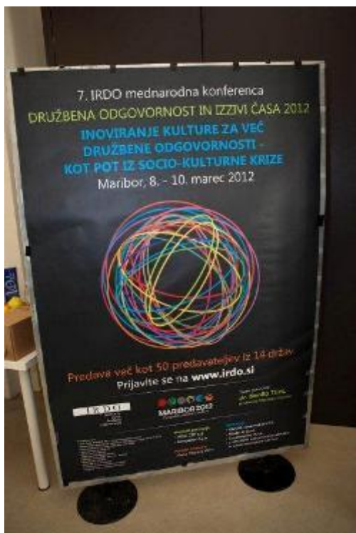
Foto utrinki s 7. mednarodne konference IRDO