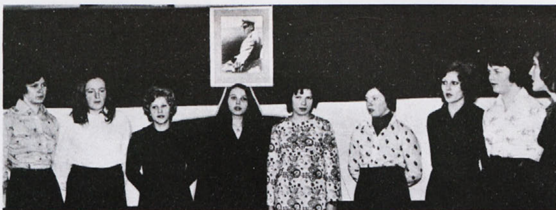
Nastop mladink TOZD Temenica Trebnje na proslavi v počastitev dneva žensk