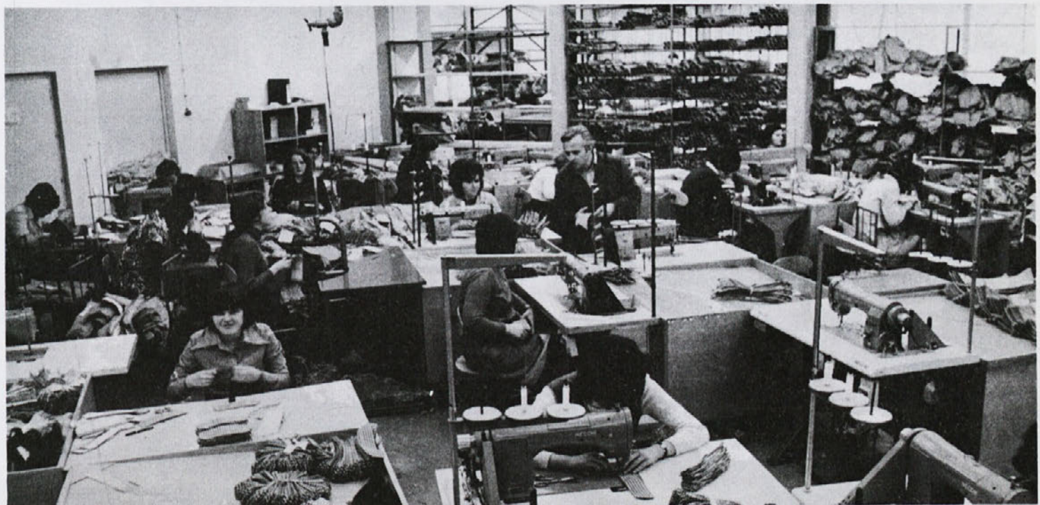
Novoustanovljena brigada, združena iz delavk bivšega Roga in TOZD Ločna, uspešno uresničuje s programom zahtevane naloge. Na sliki: pogled na del brigade

Strelska družina TOZD „Delta“ se tudi temeljito pripravlja na srečanje med TOZDI v okviru Laboda in upamo, da si bomo z dobrimi rezultati ustvarili pogoje in zaupanje za sodelovanje na tekstiliadi v strelski disciplini.