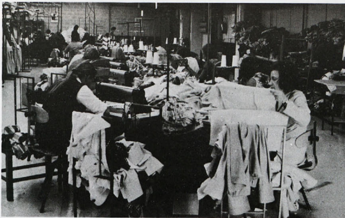
Šivanje ženskih bluz in moških srajc