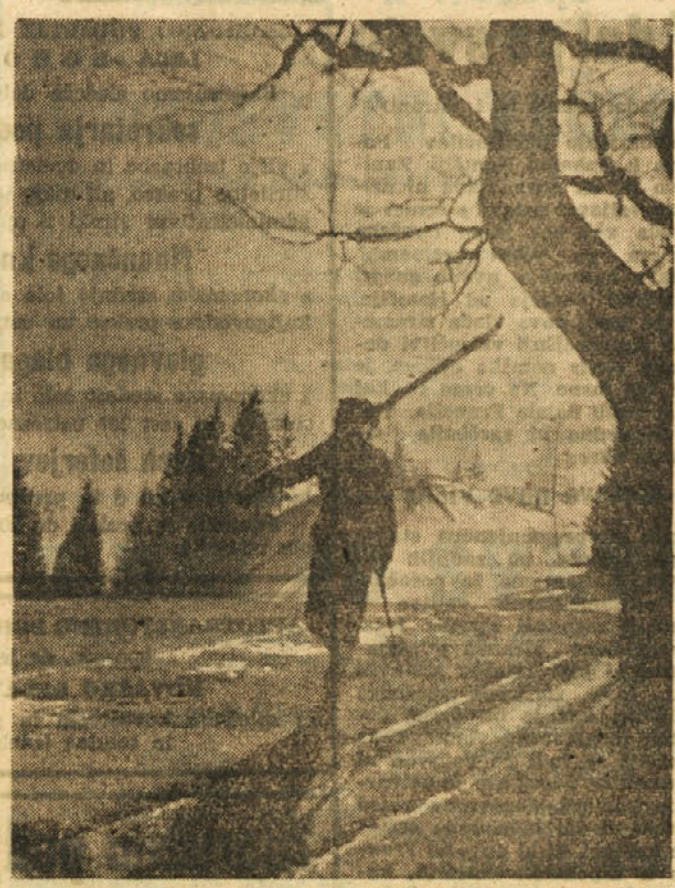
V gorah je že sneg, samo v dolini še ni