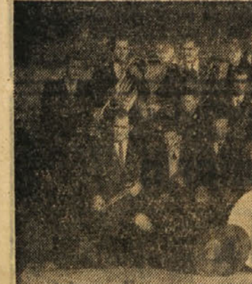
Novoudstanovljena gosp. in pionir. sekcija