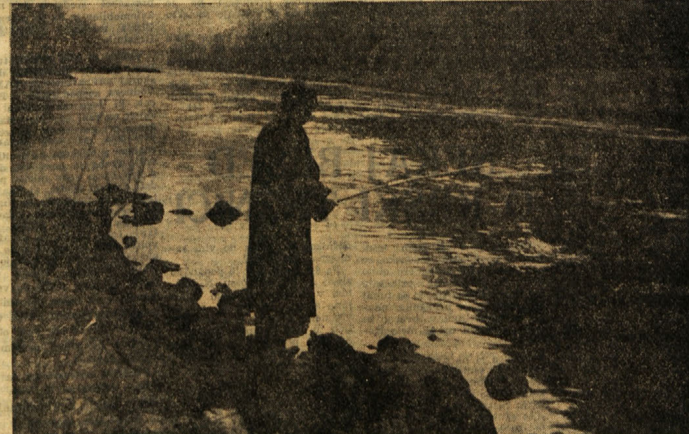
Vsak dan je ob Savi vse polno ribičev, ki potrpežljivo čakajo, da se bo vrvica napela...

Geološka raziskovanja, pa so rodila uspešne rezultate tudi na Dolu pri Hrastniku. Akoravno se zaloga premoga v Trbovljah nižajo, bo z otvoritvijo novega rudniškega obrata na Dolu mogoče proizvodnjo premoga obdržati na sedanji višini in morda še povečati. Po vseh izledih premoga v zasavskih revirjih še ne bo tako hitro zmanjkalo.