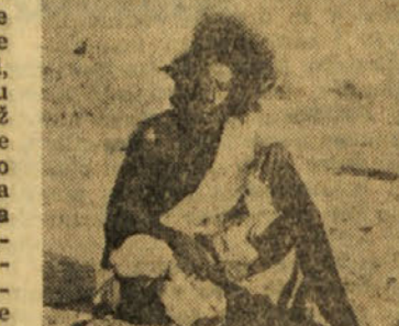
Domačin iz plemena Furzi-Wurzi v Sudanu

večja in najrazkošnejša palača v bližnjem vzhodu. Rad sem mu verjel, saj je petrolej napravil kralja za enega izmed najbogatijih ljudi na svetu. Kmalu sem se naveličal hoje po mestu, prahu in pa neprestanega čakanja na prehod preko ceste. Po številu avtomobilov