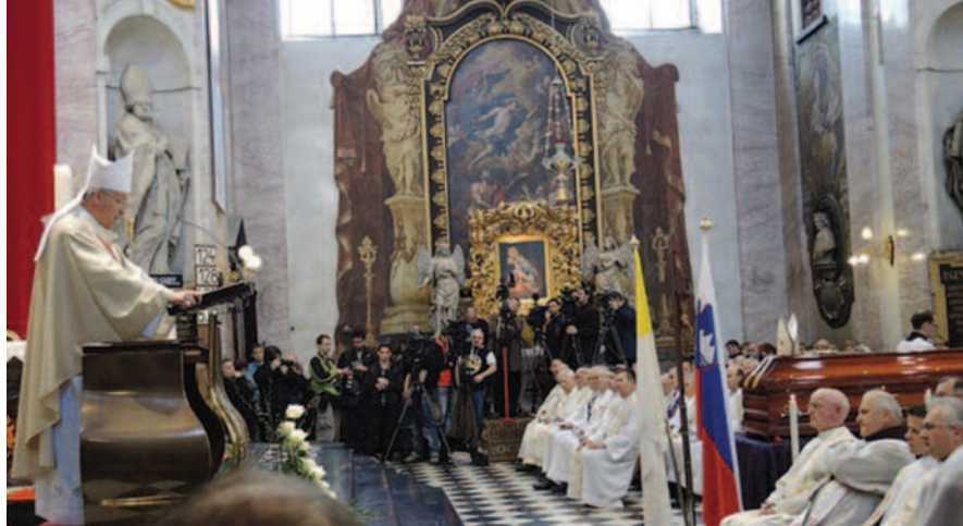
V ljubljanski stolnici

moremo spregledati, da na tisoče žrtev vojne in revolucije še čaka na pokop in poslednje prebivališče, ki bo „v skladu z neodtujljivim dostojanstvom sleherne osebe“.