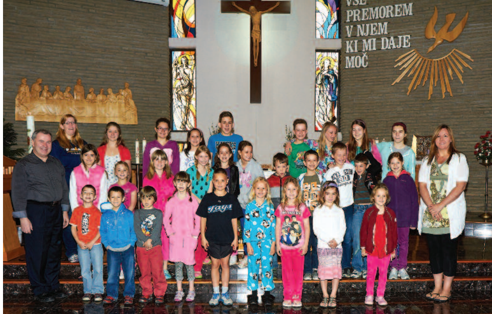
Otroci Slovenske šole v Hamiltonu

Sava-Breslav smo se zbrali k blagoslovu zelenja pred dvorano. Po koncu maše jih je veliko ostalo še na dobrem kosilu. Slovenska skupnost društva Triglav pa je praznovala v cerkvi St. John the Divine. Po maši smo ob dobrotah gospodinj pokramljali še v dvorani.