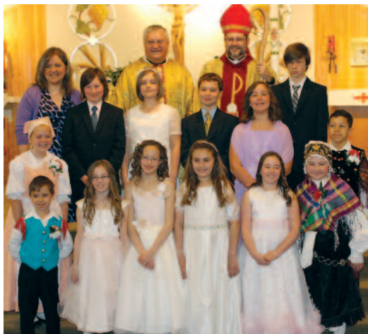
Na praznik svete birme

Prvo obhajilo • Na binkoštni praznik, 19. maja, smo imeli slovesnost prvega obhajila. Deset