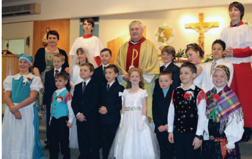
Na praznik provega sv. obhajila v Montrealu

drugi pa bolj slovesen. Poslušanje Trpljenja našega Gospoda Jezusa je pokazal na resnost, potrebnost in korist župnikovega vabila k pripravi.