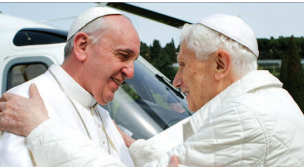
Oba papeža se skupno srečata