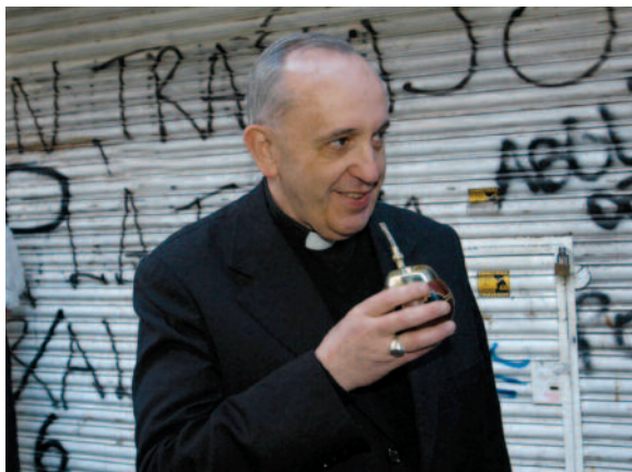
Pri pitju mate-čaja