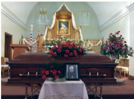
V cerkvi Marije Pomagaj v Lemontu

Seveda pa je po njegovih ocenah današnje dejanje kljub vsej pomembnosti le eno dejanje v verigi dejanj, ki so bila in še bodo potrebna, da „se bodo k nam povrnila edinost, sreča, sprava“. Kot je spomnil, ne