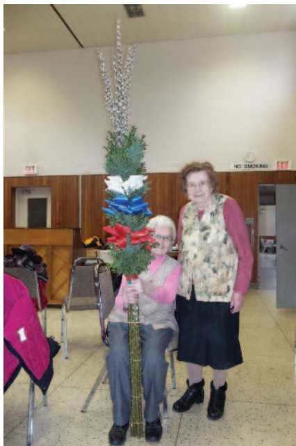
Največja butarica je bila za v cerkev

Lepo so zapeli 'akapela' (brez spremljave inštrumentov) pri sveti maši. Po sveti maši pa so nas