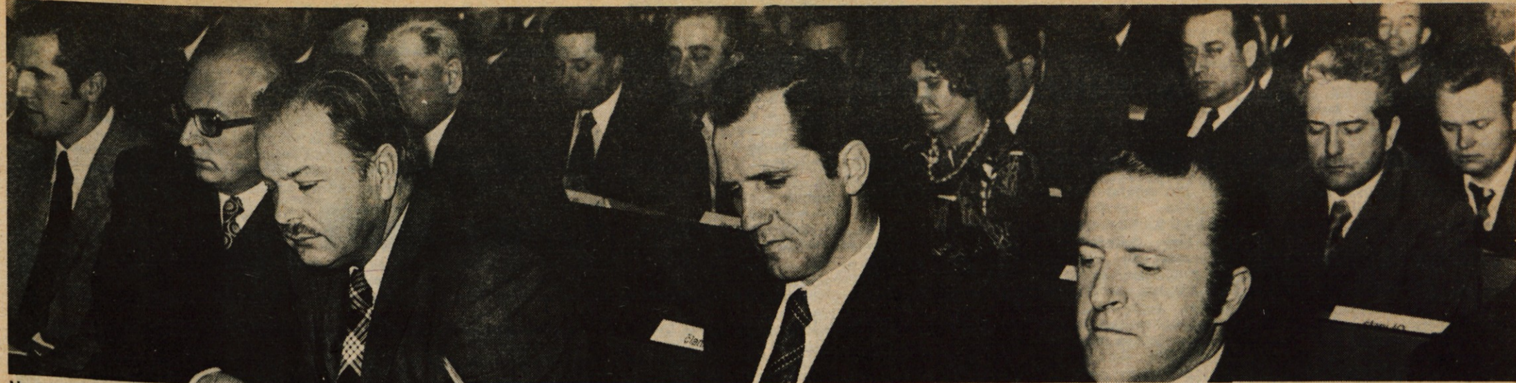
Na trinajstem rednem zboru Ljubljanske banke v četrtek v Kranju, kjer je 22 delegacij iz podružnic razpravljalo in odločalo o poslovnih politikah v tem in prihodnjem letu, je govoril tudi predsednik slovenskega izvršnega sveta inž. Andrej Marinc