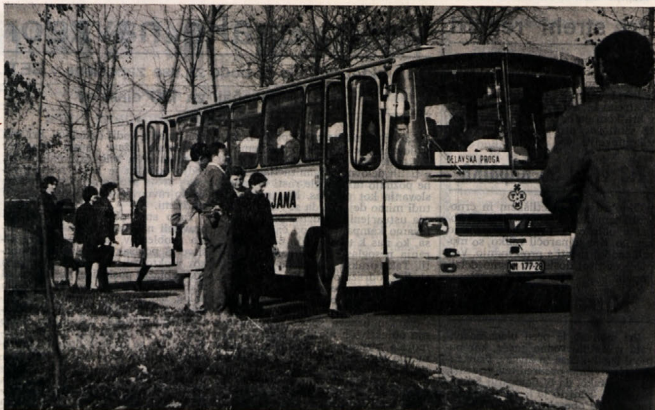
Viatorjevi avtobusi tudi zaposlene iz BETI prevažajo na delo in domov. Ta pridobitev je zlasti za matere velikega pomena