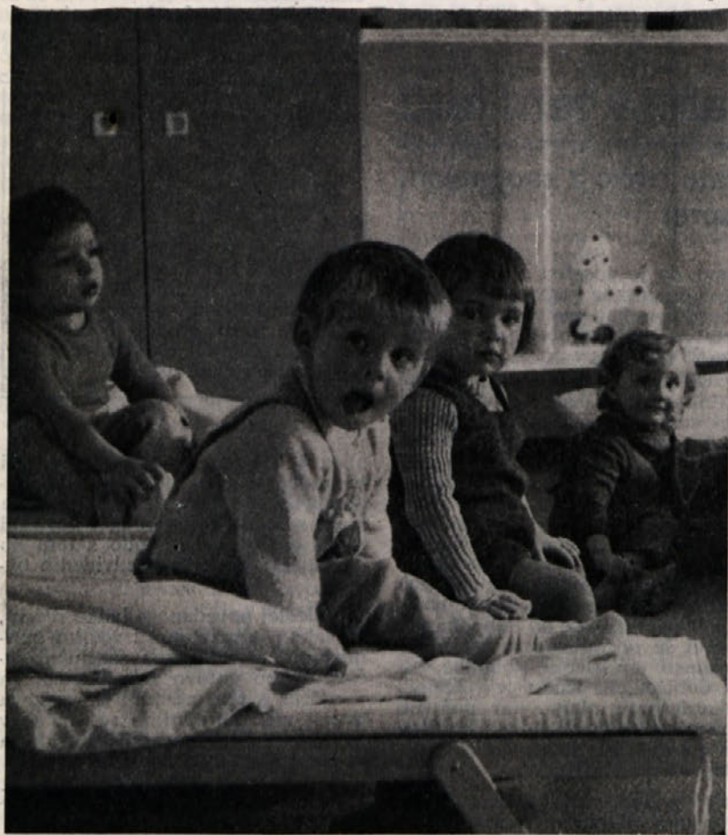
V metliški otroško varstveni ustanovi, ki je ena najlepše urejenih na Dolenjskem, je tudi precej otrok staršev zaposlenih v BETI. Kdor ima otroka v takem okolju, je lahko na delovnem mestu brez skrbi, kar se pozna tudi pri storilnosti.