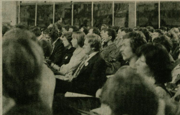
Delegati OK ZSMS Logatec na prvem plenar. zasedanju Kongresa

Delegati na kongresu so spregovorili tudi o problemu štipendiranja in ugotovili, da se v štipendijsko politiko veliko premalo vključujejo dijaki, še posebej pa študentje. Zato pride do napačne štipendijske politike, to pa je posledica nekoordiniranega dela na