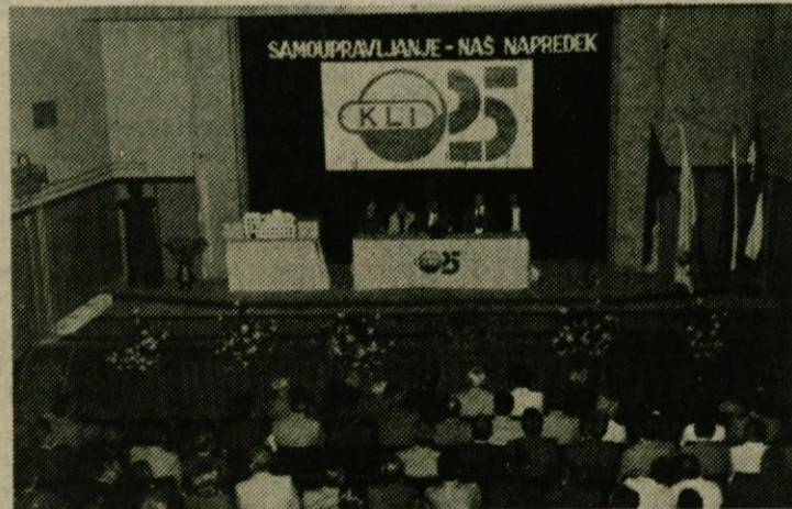
Svečana seja Delavskega sveta DO KLI Logatec ob 25-letnici ustanovitve

Po končani svečanosti se je vreme le toliko uneslo, da smo ob