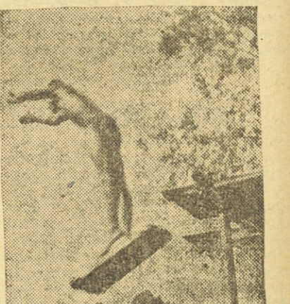
»Smučar« je pravkar odskočil s skakalnice. Smučji spusti z nog, saj pa se požen v vodo