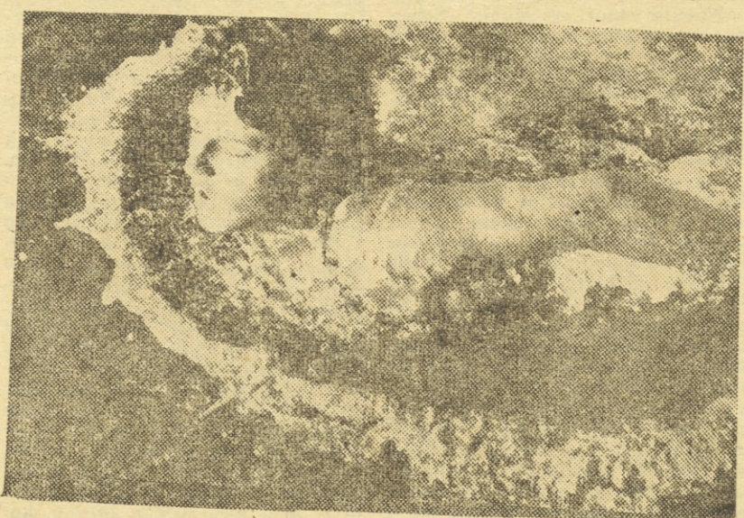
Mirjana Vukičeva je ena naših najboljših plavalk metuljčka