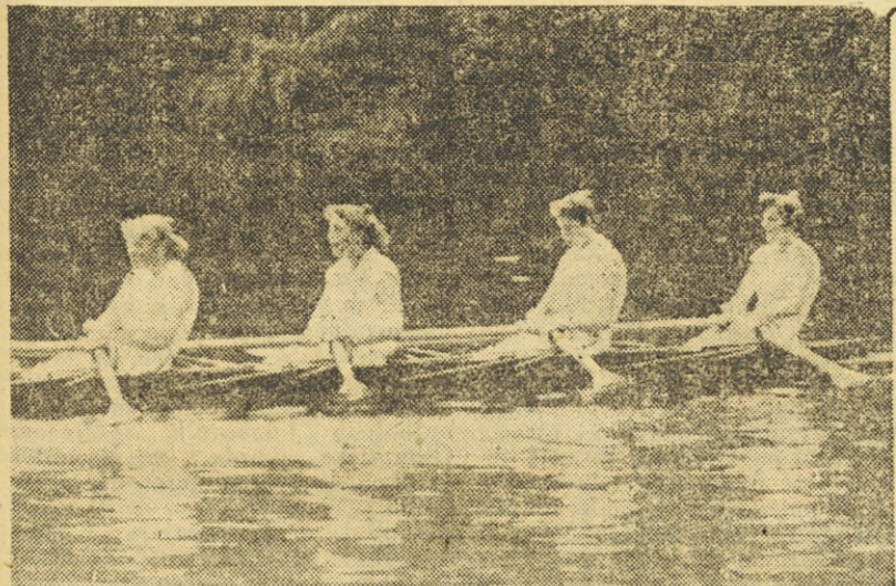
Vestnice danskega četverca so se morale zadovoljiti z zadnjim mestom

Goriški športniki pa so v nadaljnjem razgovoru razkrili nov problem, ki jih že precej dolgo žuli. Ta problem je — pomanjkanje nasprotnikov. Kot vemo, je ta panoga razvita pravzaprav le v Puli in še v Ljubljani. Tako tekmujejo vedno samo z enimi in istimi nasprotniki, s Pulo in Ljubljano. Goričani imajo kot prebivalci obmejnih krajev