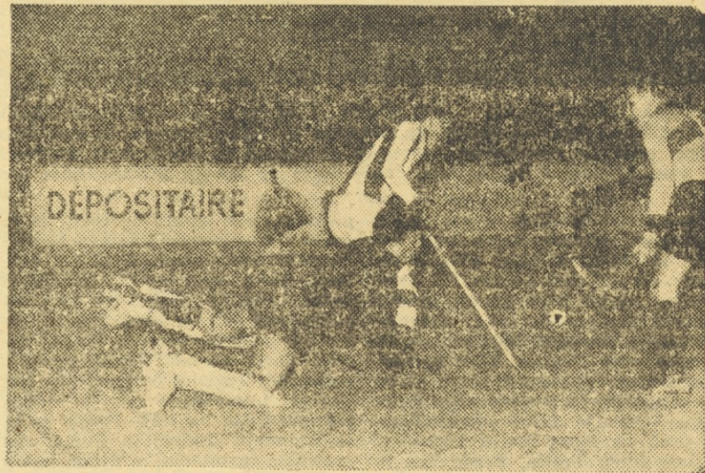
Moštvo Nove Gorice na svetovnem prvenstvu