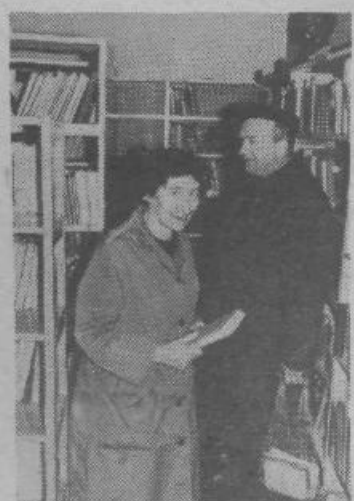
Gneča, gneča in zopet gneča. To bi lahko rekli za knjižnico in čitalnico Jožeta Mazovca v Mostah