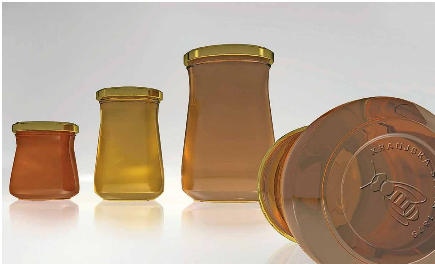
Kozarci za med slovenskega porekla

V povezavi s pomanjkanjem kozarcev za med slovenskega porekla smo se obrnili na koncesionarja. Podjetje Stenko, d. o. o., pojasnjuje, da kozarcev za med slovenskega porekla primanjkuje zaradi zmanjšane ponudbe na trgu stekla, ki je posledica vojne Rusije z Ukrajino, na drugi strani pa se povpraševanje čebelarjev zaradi razmeroma dobre čebelarške sezone v primerjavi s prejšnjimi leti in informacije o pomanjkanju kozarcev povečuje.