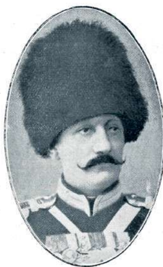
SRBSKI PRINC ARZEN.

Skader je branilo sicer le 6000 mož redne armade, a pridružilo se jim je 18.000 prostovoljcev iz sosednje Albanije, sami mohamedanci, vajeni drznih gorskih bojev. Na Taraboš je Hasan Riza bej postavil 2500 vojakov in 1500 prostovoljcev. Črnogorski general Martinović je hotel Taraboš z naskokom vzeti, a Turki so vrgli napadalce dol po strmi gori, in Črnogorci so izpre-