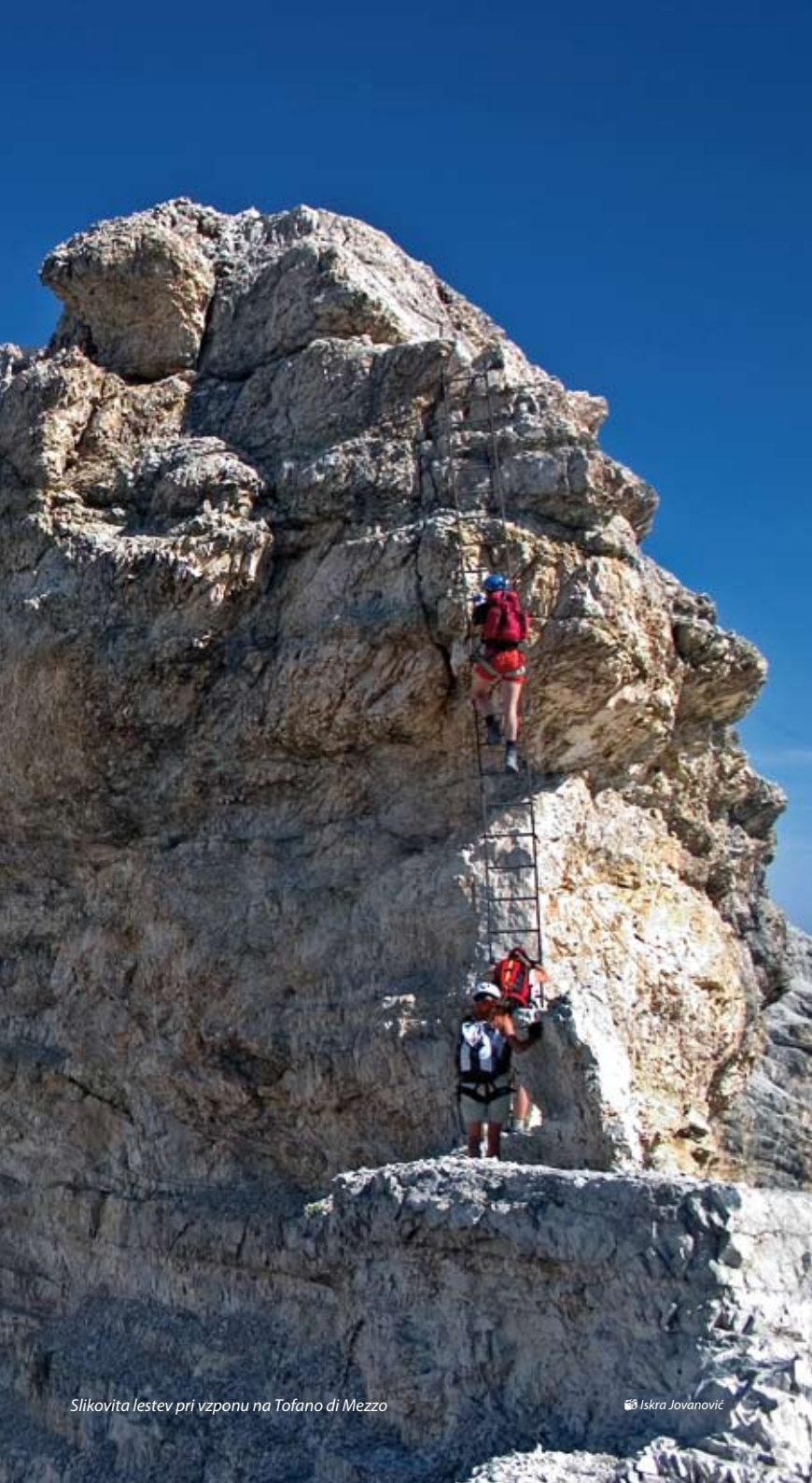
Slikovita lestev pri vzponu na Tofano di Mezzo