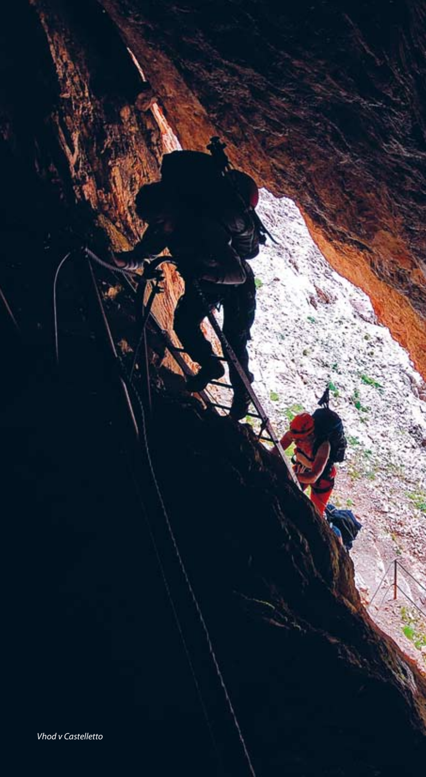
Vhod v Castelletto