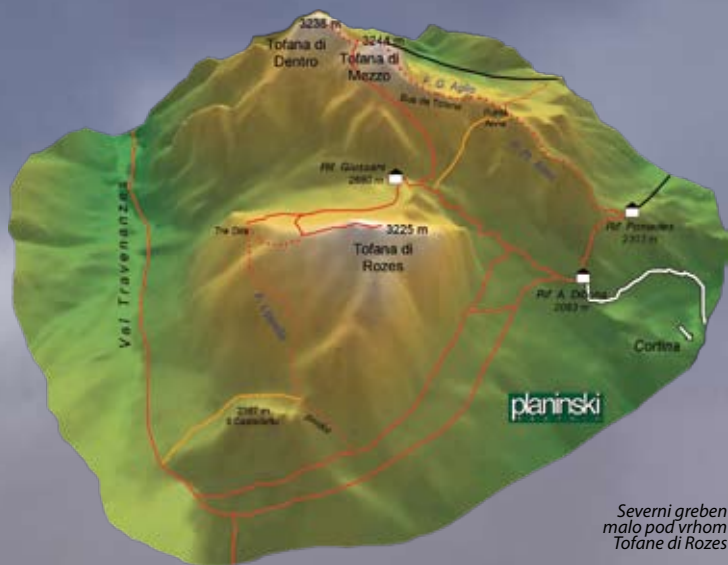
Severni greben malo pod vrhom Tofane di Rozes