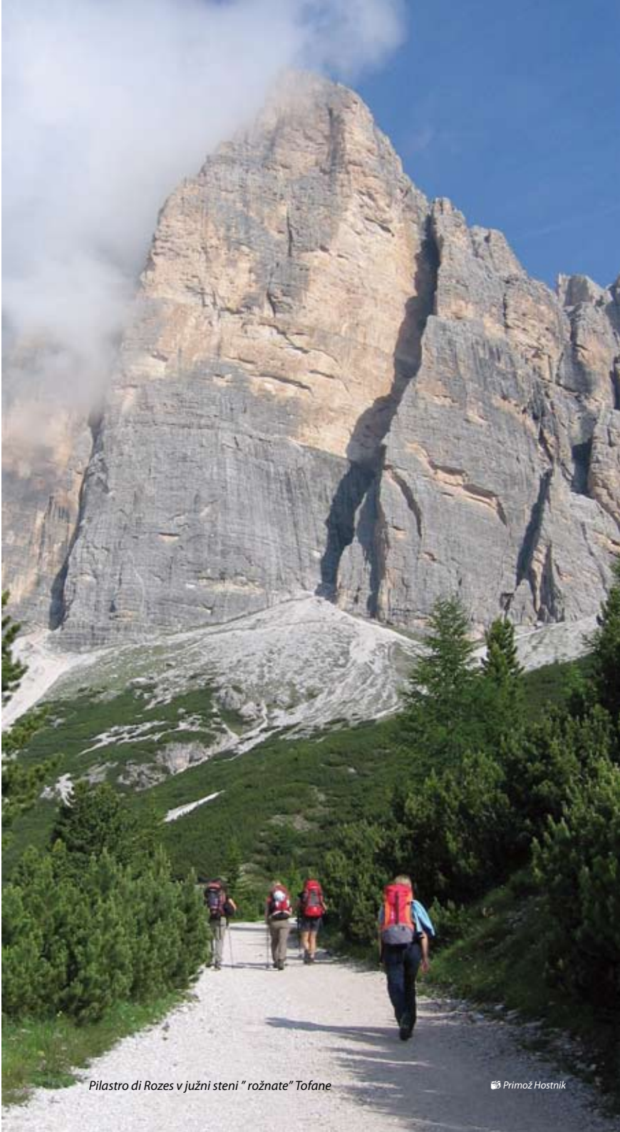
Pilastro di Rozes v južni steni "rožnate" Tofane