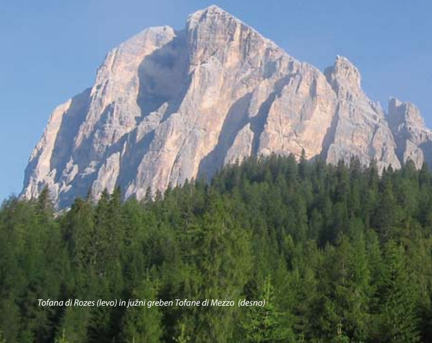
Tofana di Rozes (levo) in južni greben Tofane di Mezzo (desno)

Kot smo že omenili, je najimenoitnejša izmed treh Tofan Tofana di Rozes , ki je pomaknjena najbolj na jug. Res veličastna gora z 800 m visoko in strmo južno steno, v kateri ločimo osem izrazitih stebrov, ki ustvarjajo podobo mogočne gotske katedrale. Ko v zahajajočem soncu