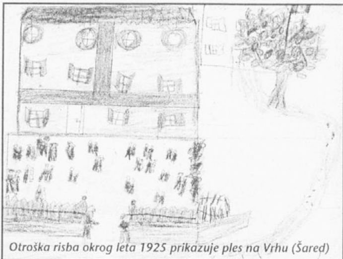
Otroška risba okrog leta 1925 prikazuje ples na Vrhu (Šared)

Starši naj k vpisu prinesejo fotokopijo otrokovega rostnega lista.