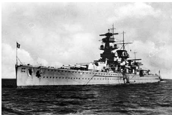
Nemška oklopna križarka Admiral Graf von Spee, splovljena 6. 1. 1936. Ob izbruhu vojne je bila na Atlantiku. Od septembra do decembra 1939 je potopila 9 britanskih trgovskih ladij. Po boju z britanskimi pomorskimi silami pri ustju reke Rio de la Plate, v katerem je bila poškodovana, jo je posadka 17. 12. 1939 potopila pri Montevideu.

(aprila 1940), v Belgiji in na Nizozemskem, ter v vojni za Anglijo. 40 Delavska politika je ob tem opozorila na nov način bojevanja, uveden z uporabo padalskih enot. Na podlagi sorazmerno precej uspešne nizozemske in belgijske zavrnitve nemških padalskih enot spomladi 1940 pa je menila, da se omenjeni način bojevanja v glavnem ni obnesel. 41 Socialisti so poudarili bistveno večji pomen neposrednega bojnega delovanja letalstva. Osredinili so se na njegovo vlogo v nemškem napadu na Anglijo, ki so jo večplastno ocenili. Glavni poudarek v oceni socialistov je bil, da so nemški letalski napadi uvod za splošen napad Nemčije na Anglijo, saj bo Hitler skušal izkrcati svoje enote na angleškem ozemlju. Nemci si zato prizadevajo uničiti angleško letalstvo ter letalska in morska oporišča, obalne baterije, industrijo in prometne naprave, da bi ob izkrcanju onemogočili sovražnikov odpor. 42 Delavska politika je ob tem opozorila še na psihološki učinek nemških bombardiranj. Bom-