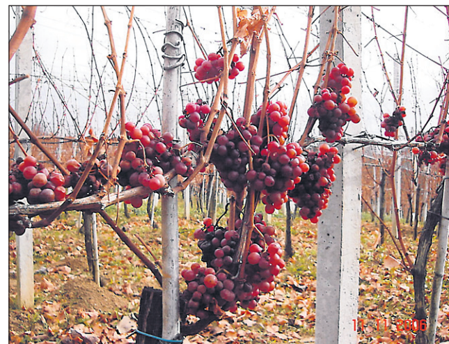
Iz takih grozdov je nastal do januarja nastajal jagodni izbor dišečega traminca.