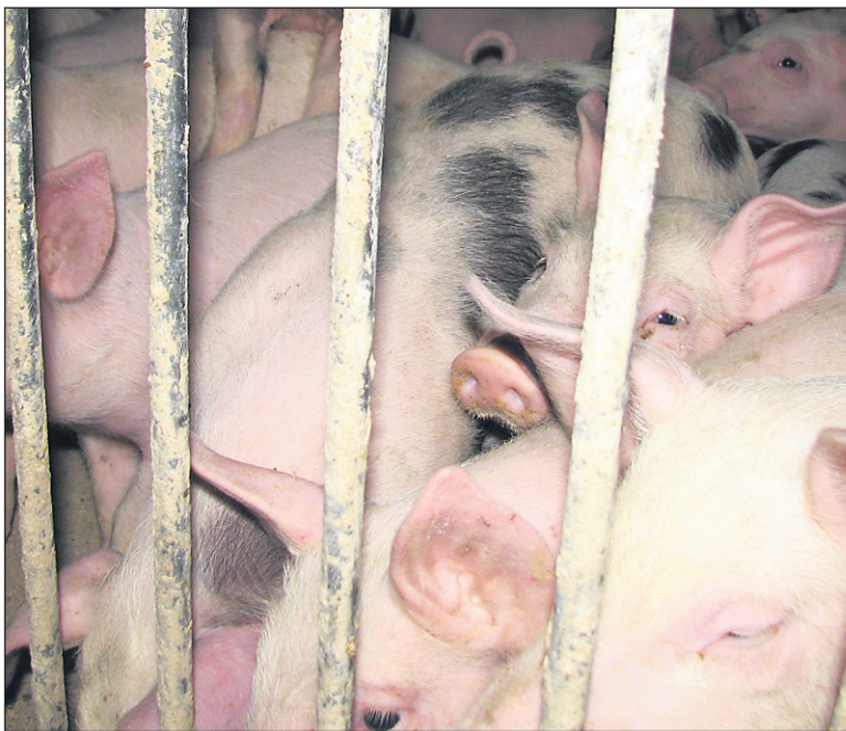
Samooskrba s prašičjim mesom se v Sloveniji bliža 30 odstotkom, kar je najnižje doslej.

Pribožič ob tem pravi, da je uklanjanje domače prašičereje cilj tujih močnih prašičerejskih držav, saj bodo potem lahko prosto diktirale cene, ki nikakor ne bodo nizke: „Mi pa se bomo v najboljšem primeru ukvarjali le še s pitanjem, reševali vedno večje ekološke zahteve glede gnojevke, po pitancu pa se že zdaj in se bo tudi v prihodnje izredno malo zaslužilo. Zdaj se je treba odločiti, kaj in kako naprej.“