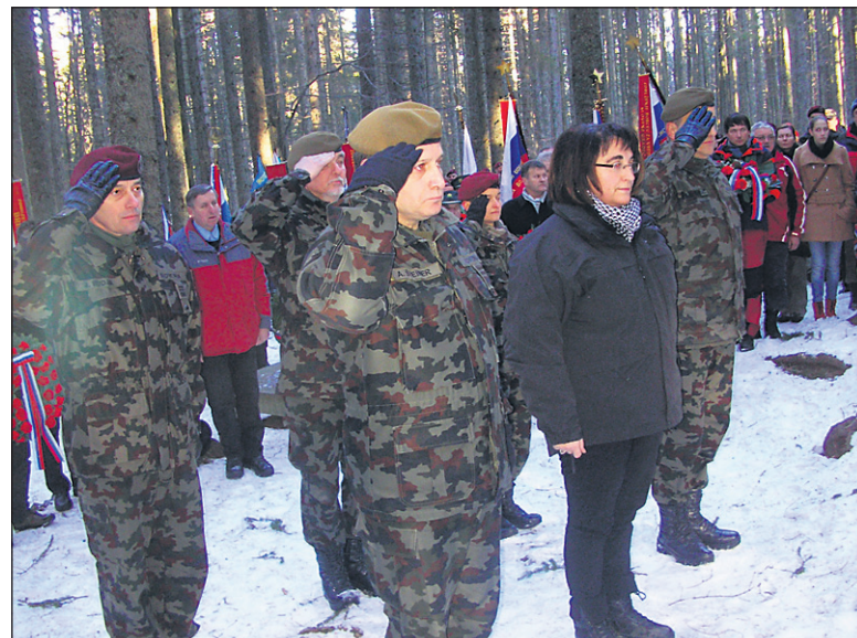
Na spominski slovesnosti na bojišču Pohorskega bataljona sta bila tudi ministrica za obrambo Ljubica Jelušič in generalmajor Alojz Šteiner , načelnik Generalštaba Slovenske vojske.