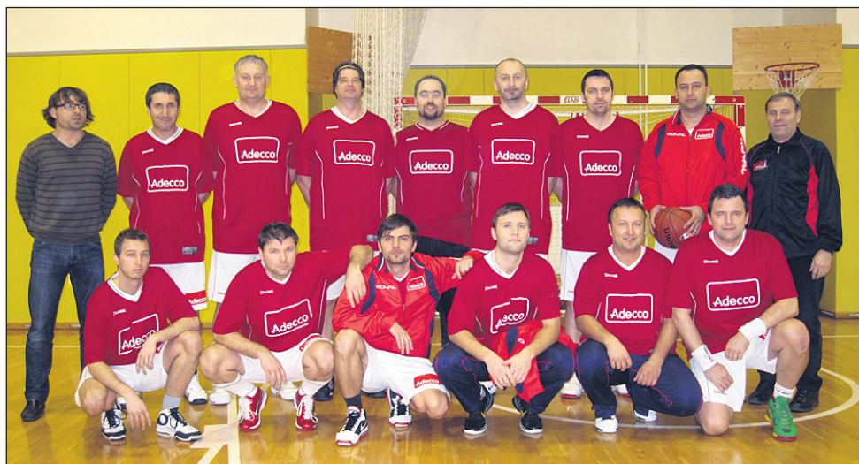
Ekipa KK Adecco (na fotografiji) je v 6. krogu nekoliko presenetljivo ugnala ekipo Starše.