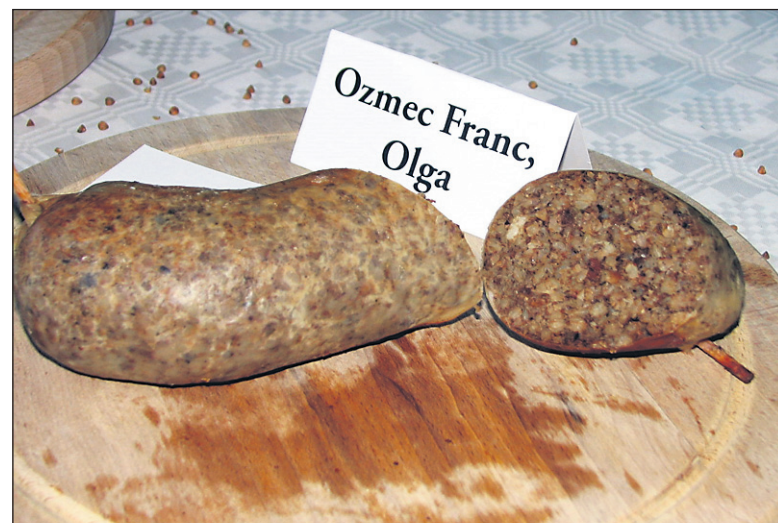
Po kvaliteti so letos izstopale sive in bele čurke, med izdelovalci čurk pa sta se spet izkazala Franc in Olga Ozmec iz Cvetkovcev.