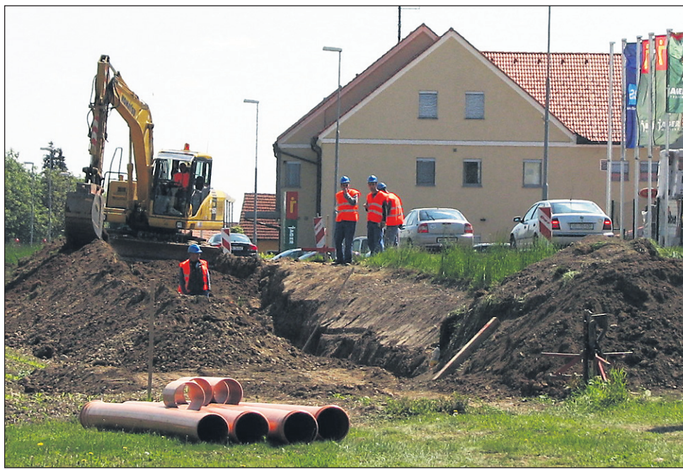
Ministrstvo za okolje trdi, da je pavšalna odmera komunalnega prispevka oz. priključnine na kanalizacijsko omrežje (ki jo izvajajo praktično vse spodnjepodravške občine, saj je za občane ugodnejša) nezakonita ...

Kaj je prav, kdo dela prav in v skladu z zakonom in kdo ne, do kje sežejo pooblastila občin (in občinskih svetov)