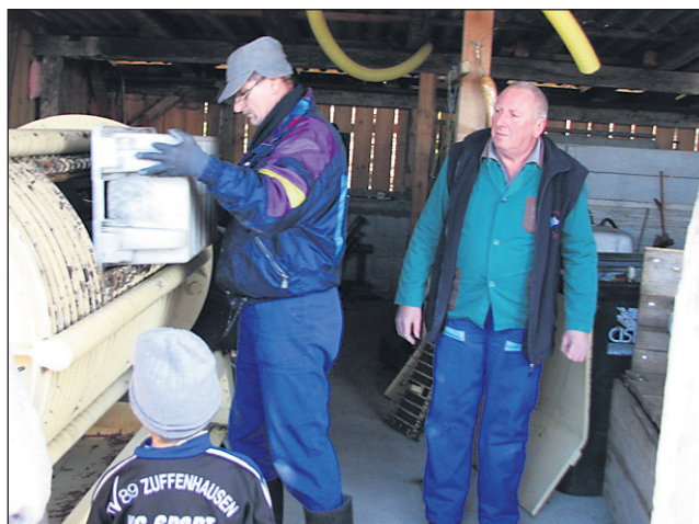
Dolga pot do vina – suhega jagodnega izbora (laški rizling) se začne s počasnim stiskanjem.