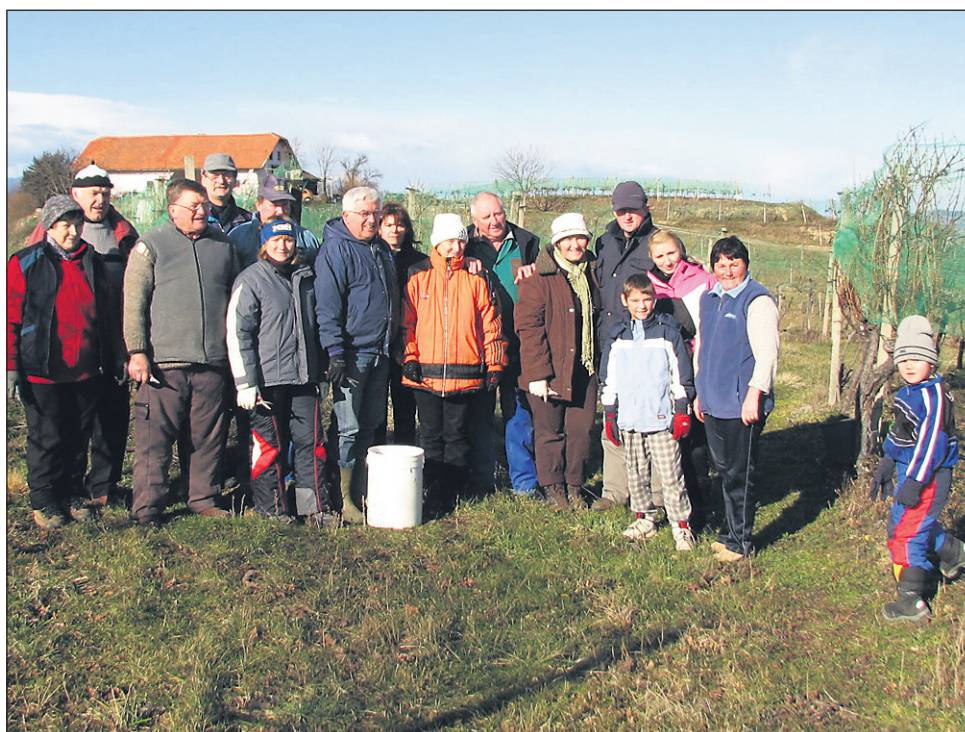
Vesela ekipa trgačev pri Gregorečevih je imela polne roke dela, dokler ni bila pobrana zadnja suha jagoda na vseh 400 trsih.

„Grozdje je zdaj treba zelo previdno obrati, paziti je treba na vsako jagodo in jo pobrati, če slučajno pade na tla. Pa potem delo še zdaleč ni končano. Vino, ki ga bomo verjetno poimenovali kar antonovo, bo zahtevalo še veliko dela, preden bo dozorelo. Negovanje in kletarjenje bo še zelo zahtevno. Ko bomo potrgali vse suho grozdje, sledi počasno stiskanje, potem hiter razsluz in kvalitetno čiščenje, dobro izbrane pra-