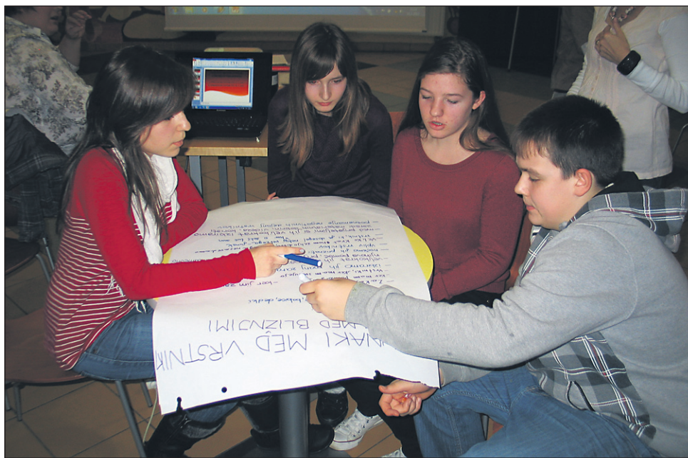
Otroci so imeli zanimiva stališča.

»Po mnenju večine parlamentarcev so junaki tiste osebe, ki so storile nekaj pogumnega oziroma junaškega, so znani po svetu in jih kot junake vidi množica ljudi, ne le posamezniki. Čeprav je sprva kazalo, da so junaki v