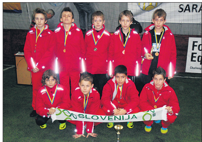
Ekipa FC Ptuj U-13 je odlično odigrala celoten turnir v Sarajevu.

Mladi nogometaši FC Ptuj so v zadnjem času zelo aktivni in so se zraven prvenstva udeležili tudi nekaj turnirjev. Tokrat so nastopili v Sarajevu in v močni in številni konkurenci osvojili 3. mesto. Na celotnem turnirju Junior cup 2012 je sodelovalo več kot 130 ekip iz 10 držav. V skupini, v kateri je igral FC Ptuj, je tekmovalo 24 ekip.