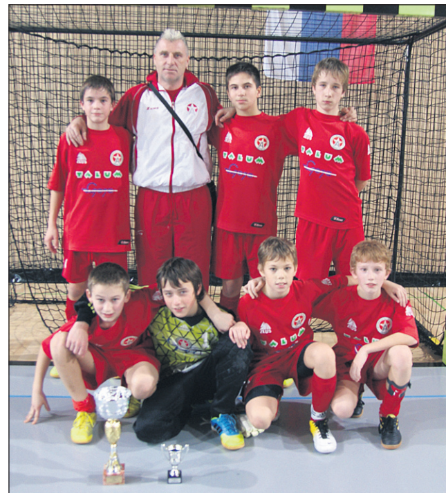
Ekipa Aluminija U-12