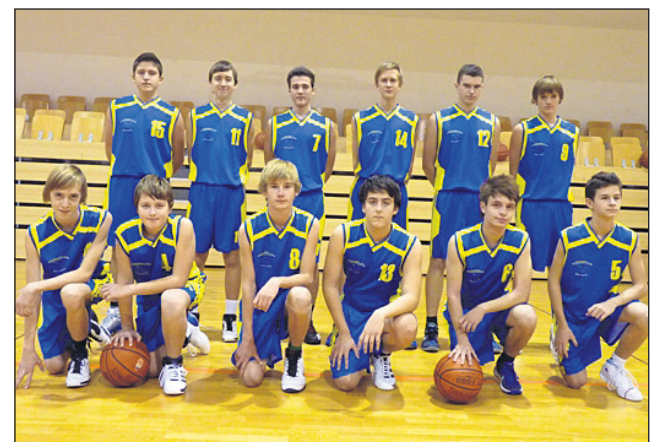
Ekipa KK Haloze