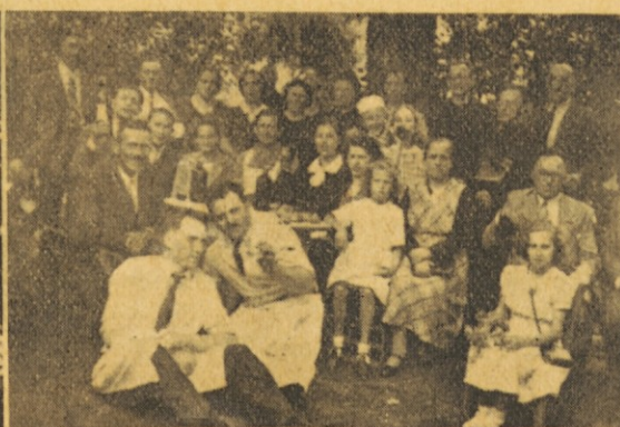
Nekaj obrazov iz San Antonio; leva skupina Paternalci; desna pa Avežanedci.